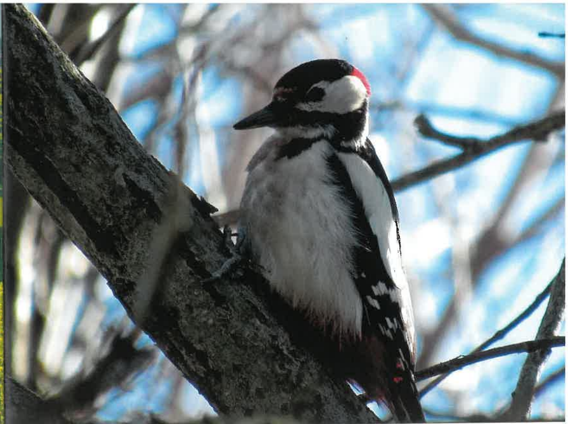
Dzięcioł duży ( Dendrocopos major )