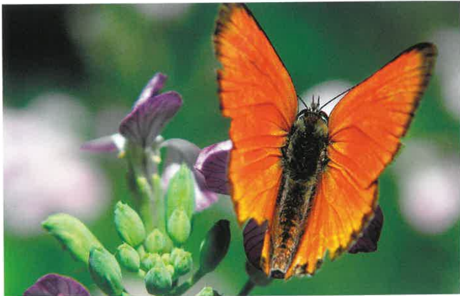
Czerwończyk nieparek ( Lycaena dispar )