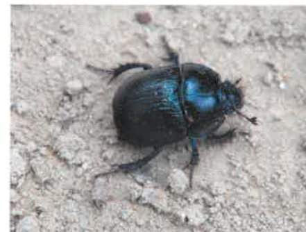
Żuk leśny ( Anoplotrupes stercorosus )