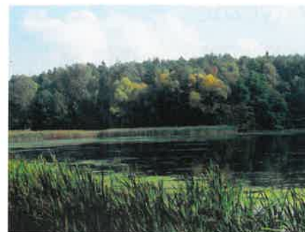
Naturalne jezioro w Podlesiu Małym

W SzPK wyróżnia się dwa rodzaje wąwozów lessowych: drogowe i wysoczyznowe. Wąwozy drogowe powstają w miejscach polnych dróg, podczas spływu wód opadowych, które wypłukują przez wiele lat lessowy muł. W ten sposób rzeźbią głębocznice i strome zbocza, często odsłaniając wapienne warstwy skał. Wąwozy wysoczyznowe tworzą się od krawędzi, wysoczyzny. Łagodne zbocza wąwozów porastają grądy.