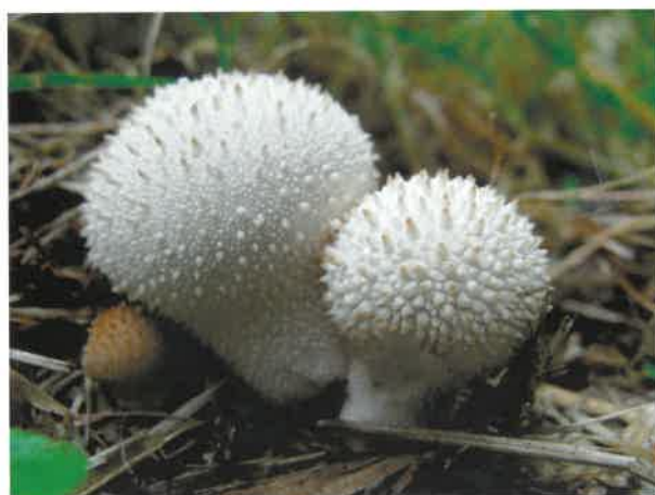
Młoda purchawka chropowata ( Lycoperdon perlatum )