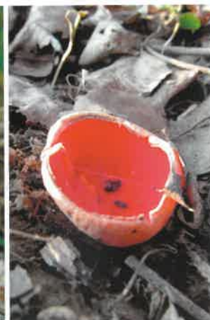
Czarka szkarłatna ( Sarcoscypha coccinea )