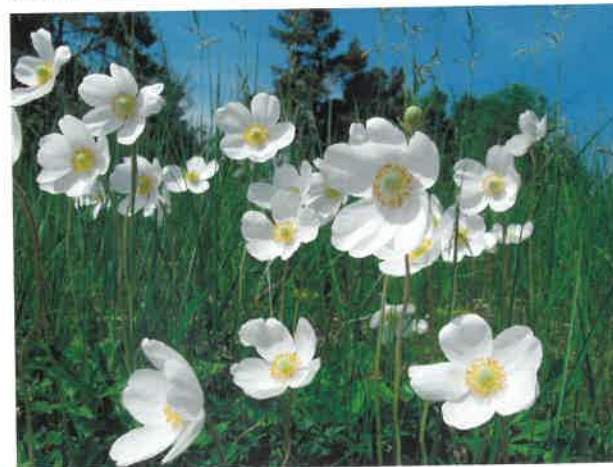
Zawilec wielkokwiatowy ( Anemone sylvestris )