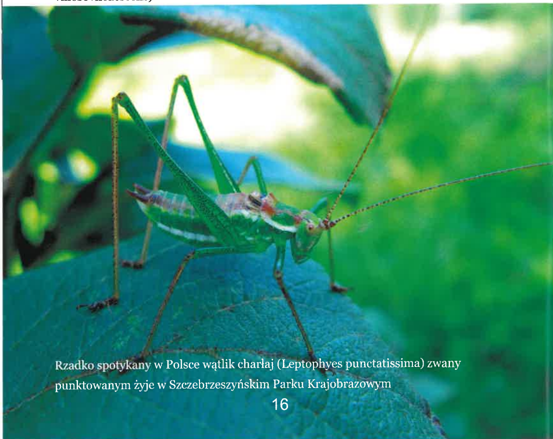
Rzadko spotykany w Polsce wątlík charłaj ( Leptophyes punctatissima ) zwany punktowanym żyje w Szczepreszyńskim Parku Krajobrazowym