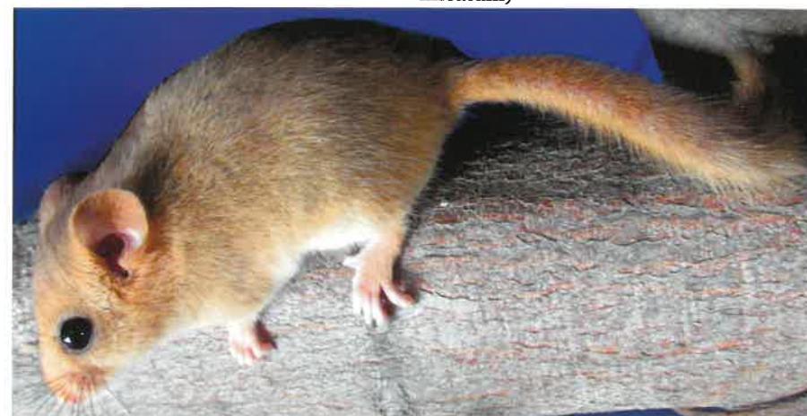
Orzesznica ( Muscardinus avellanarius )