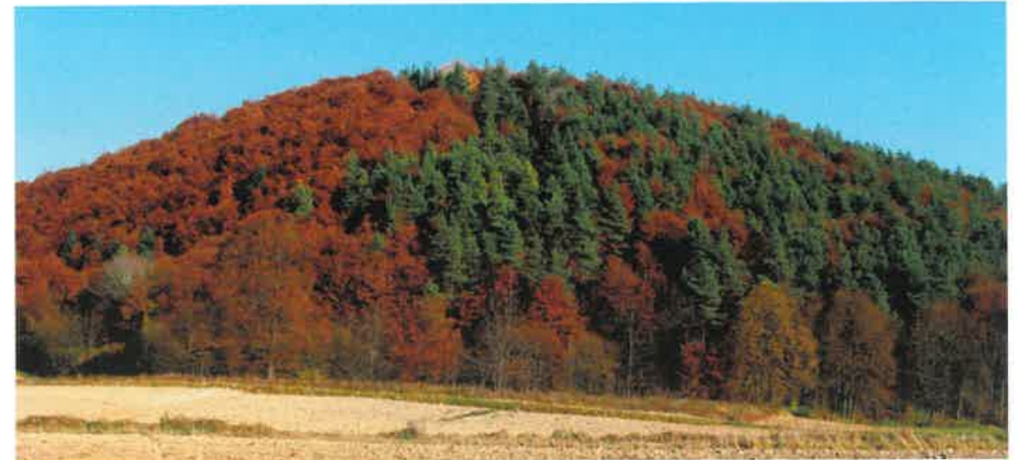
Czubata Góra w Kawęczynku ma wysokość 324 m n.p.m., porasta ją buk i sosna

Zespół Lubelskich Parków Krajobrazowych został utworzony uchwałą Lubelskiego Sejmiku Województwa Lubelskiego z 9 grudnia 2009 roku. Obejmuje swym działaniem tereny 17 parków krajobrazowych i 17 obszarów chronionego krajobrazu. ZLPK posiada 5 Ośrodków Zamiejscowych znajdujących się w: Janowie Lubelskim, Janowie Podlaskim, Chełmie, Lubartowie i Zamościu oraz Ośrodek Edukacyjno-Muzealny w Brzeźnie. Szczepreszyński Park Krajobrazowy podlega pod OZ ZLPK w Zamościu. Jednym z zadań statutowych ZLPK jest: „popularyzacja walorów przyrodniczych i kulturowych parków krajobrazowych”. Wyrazem tego jest niniejsza publikacja wydana z okazji ćwierćwiecza istnienia Szczepreszyńskiego Parku Krajobrazowego.