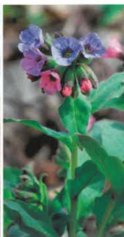
Miodunka ćma ( Pulmonaria obscura )