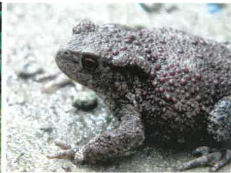
Ropucha szara ( Bufo bufo )