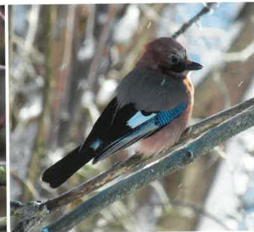
Sójka zwyczajna ( Garrulus glandarius )