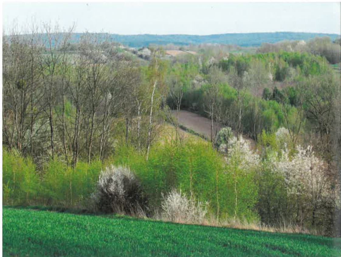
Szczepieszki Park Krajobrazowy - w ćwierćwiecze istnienia