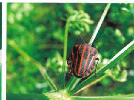
Strojnica baldaszkówka ( Graphosoma lineatum )