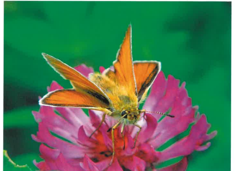
Karłatek ryska ( Thymelicus lineola )