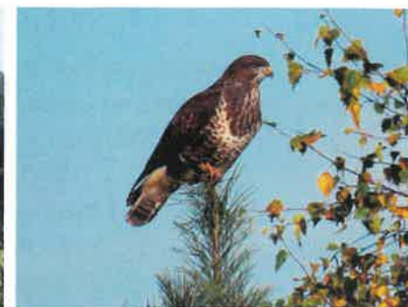
Myszołów ( Buteo buteo )