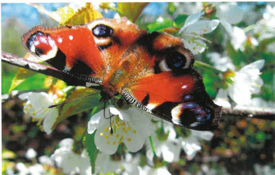
Rusalka pawik ( Aglais io )