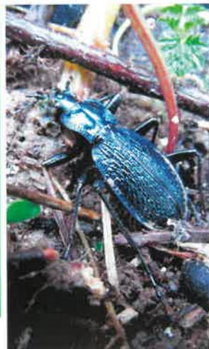
Biegacz pomarszczony ( Carabus intricatus )