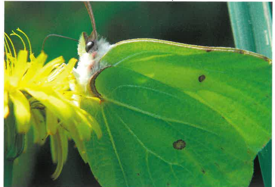
Latolistek cytrynek ( Gonepteryx rhamni )