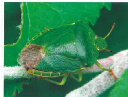
Odorek zieleniak ( Palomena prasina )