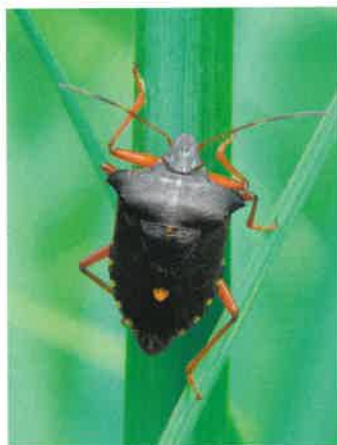
Tarczówka rudonoga ( Pentatoma rufipes )