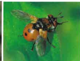
Owad Gymnosoma sp.