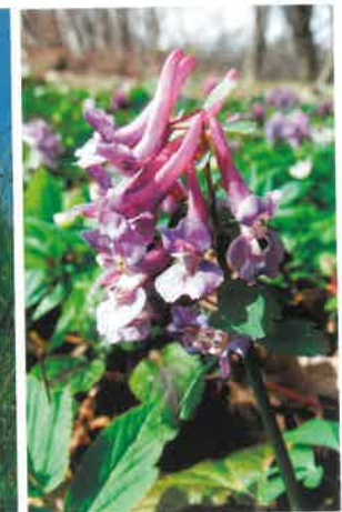
Kokorycz pusta ( Corydalis cava )