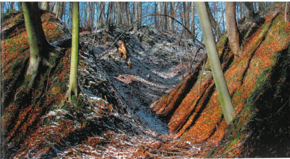
Charakterystyczne ukształtowanie terenu w Szczepieszki Parku Krajobrazowym