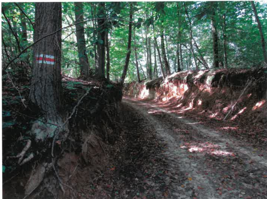
Wąwóz drogowy w Szczepieszyńskim Parku Krajobrazowym

Lessowe wąwozy, to suche doliny, które powstały w sposób naturalny lub poprzez działalność człowieka. Mają różną długość, od 0,5 do kilku kilometrów, a ich głębokość wynosić może od 1 do 20 metrów i więcej. Na zachód od Szczepieszyna, na terenie Szczepieszyńskiego Parku Krajobrazowego, ich gęstość wynosi nawet do 9 km/km 2 .