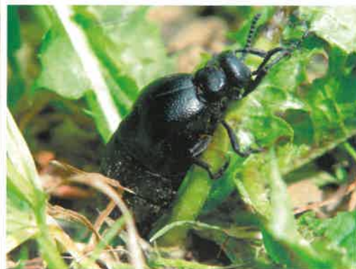
Oleica krówka ( Meloe proscarabaeus )