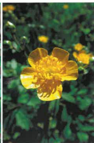
Jaskier kaszubski ( Ranunculus cassubicus )