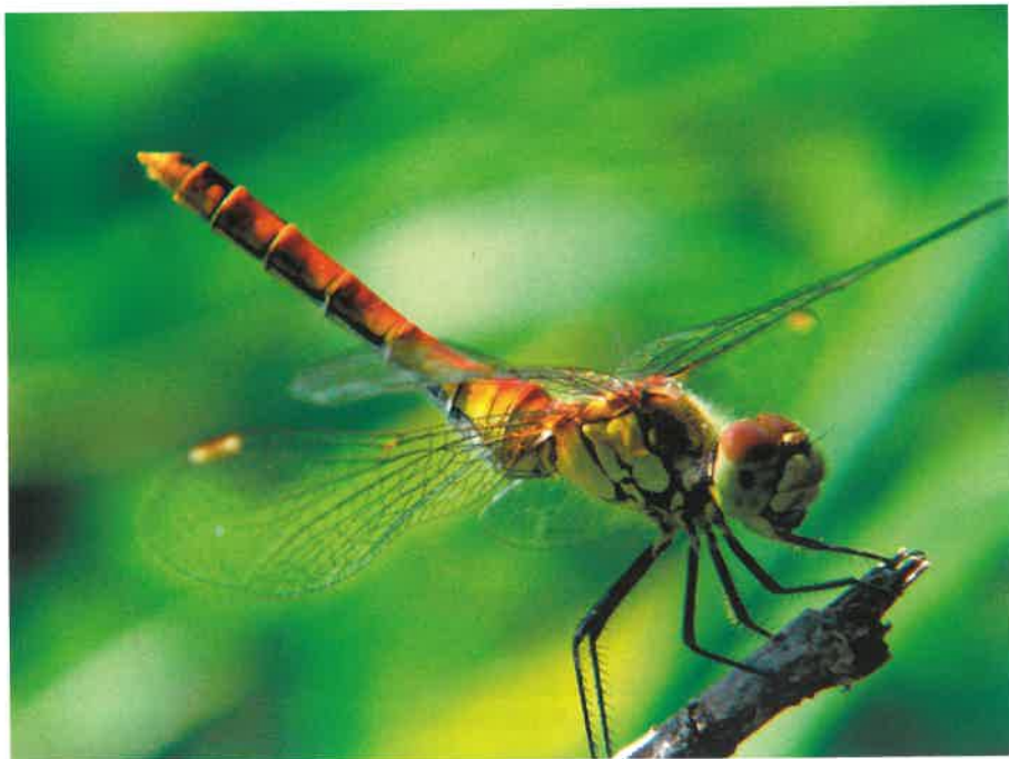
Szablak przypłaszczony ( Sympetrum depressiusculum )