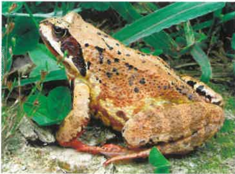
Żaba dalmatyńska ( Rana dalmatina )