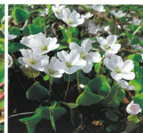
Szczawik zajęczy ( Oxalis acetosella )