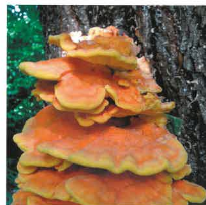
Żółciak siarkowy ( Laetiporus sulphureus )