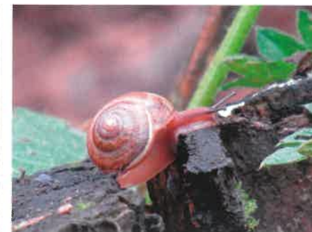
Ślimak z rodziny Helicidae