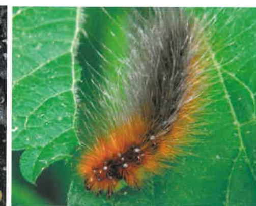
Gąsienica niedźwiedziówka ( Arctia caja )