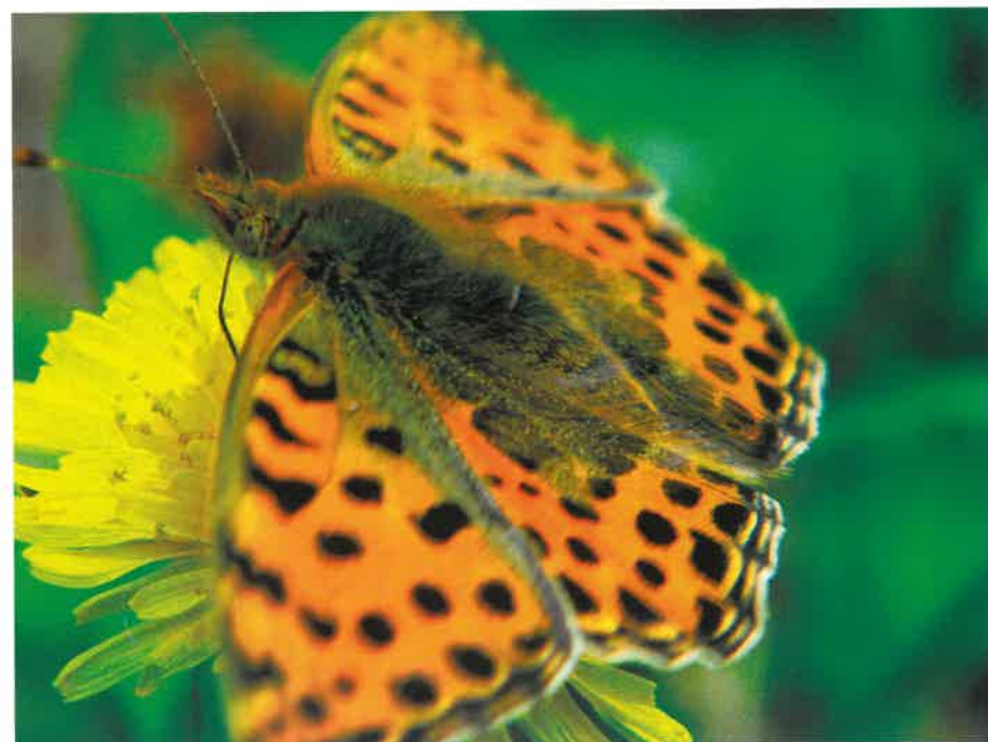
Dostojka latonia ( Issoria lathonia )