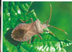
Zbrojecz dwuzębny ( Picromerus bidens )