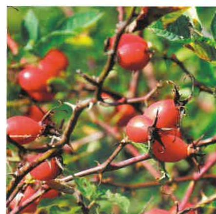
Dzika róża ( Rosa canina )