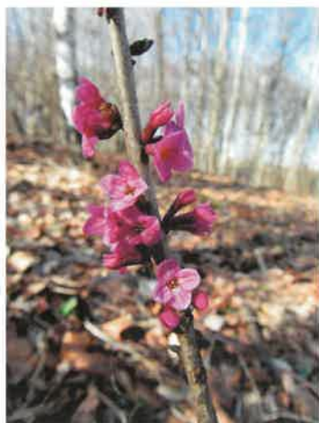
Wawrzynek wilczelyko ( Daphne mezereum )