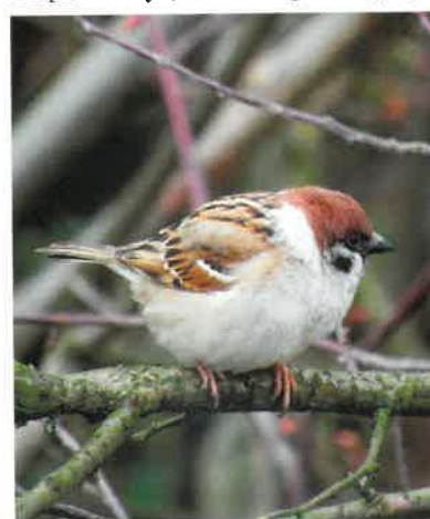
Mazurek ( Passer montanus )