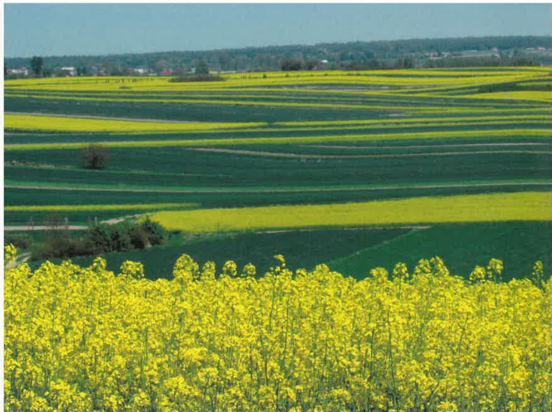
Kwitnący rzepak, to częsty widok wiosną, na polach wokół Szczepieszyna