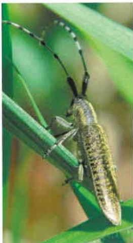
Zgrzytnica zielonkawo-włosa ( Agapanthia villosiviridescens )