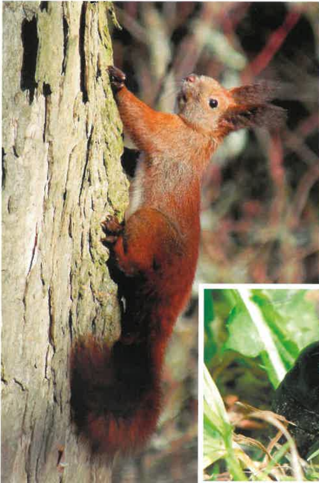
Wiewiórka ( Sciurus vulgaris )