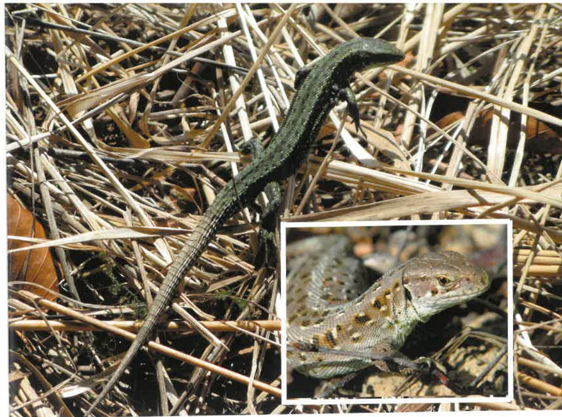
Jaszczurka zwinka ( Lacerta agilis )