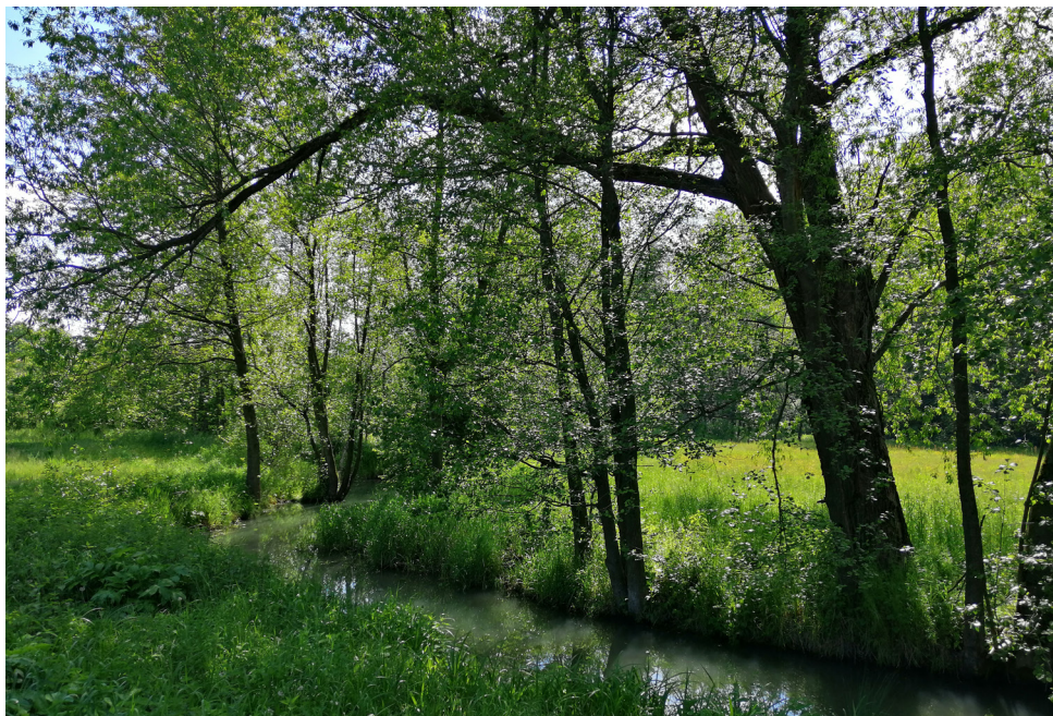
Giełczew w Sobieskiej Woli Pierwszej