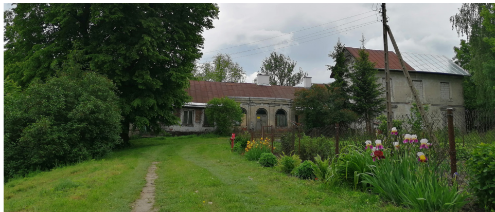
Dwór z 1905 roku w Struży. Stan w 2020 roku.