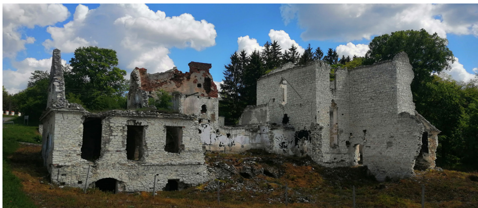
Gardzienice Pierwsze. Ruiny gorzelnianego budynku. Stan w 2020 roku

około 0,7 hektara i znajduje się w zachodniej części miejscowości nad rzeką Giełczew. Zachowało się na nim około 20 nagrobków.