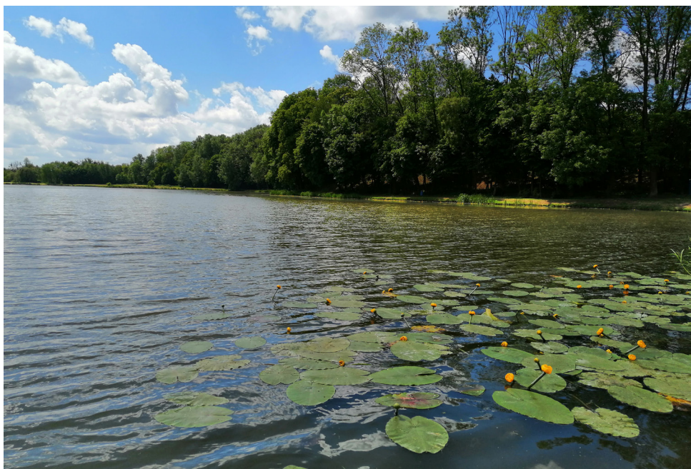
Stawy w Rybczewicach