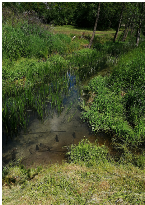
Ujście Radomirki do Giełczwi

Pracownicy Zespołu Lubelskich Parków Krajobrazowych