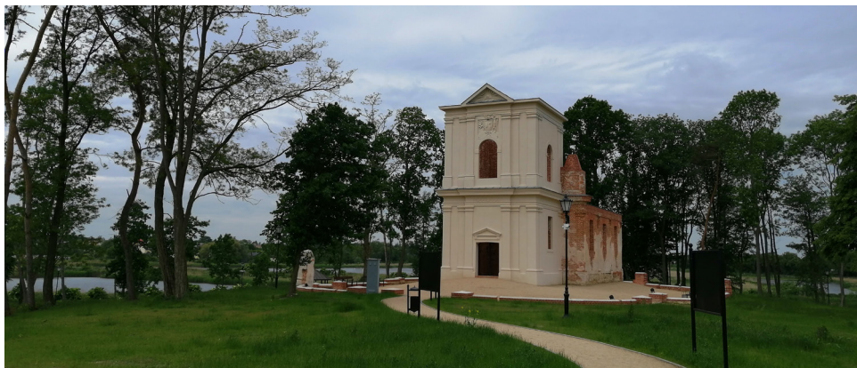
Ruiny XVIII-wiecznego zboru kalwińskiego „Kościelec”