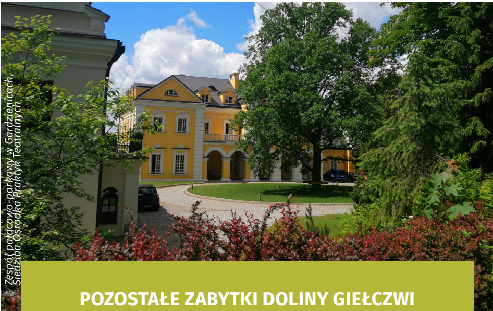
Zespół pałacowo-parkowy w Gardzienicach. Siedziba Ośrodka Praktyk Teatralnych