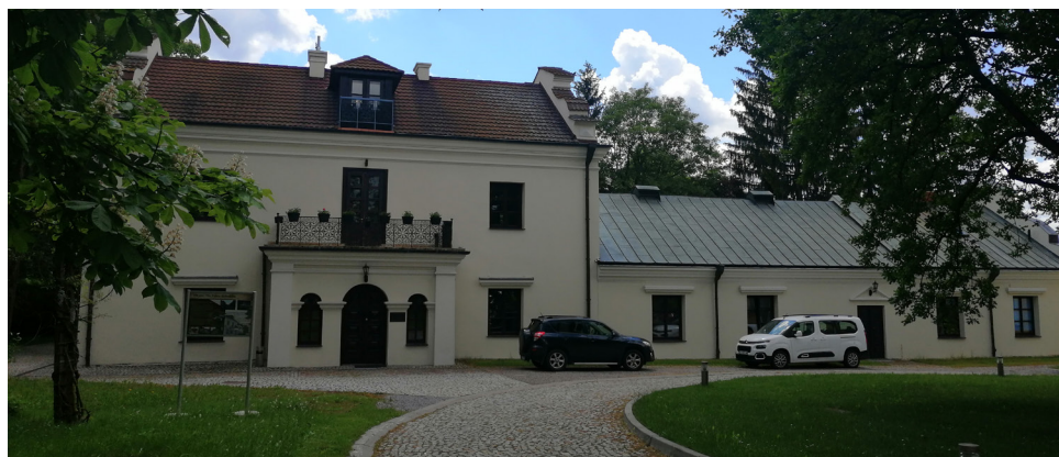
Oficyna południowa z końca XVII wieku