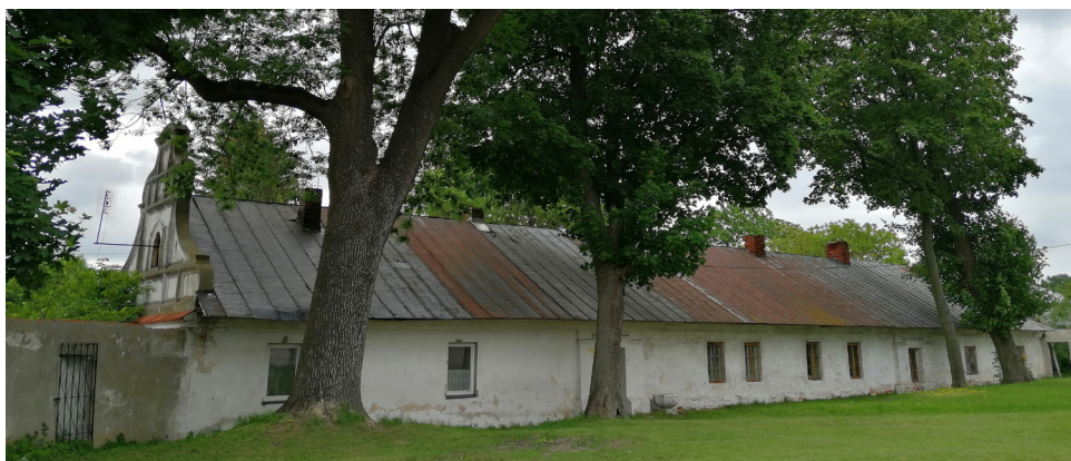
Plebania w Biskupicach