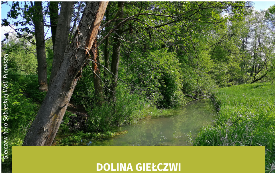
Giełczew foto Sobieskiej Woli Pierwszej