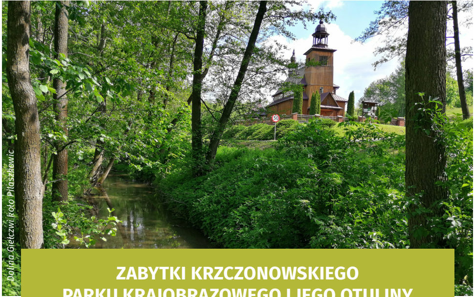
Dolina Giełczwi, Koto Piaszkowic