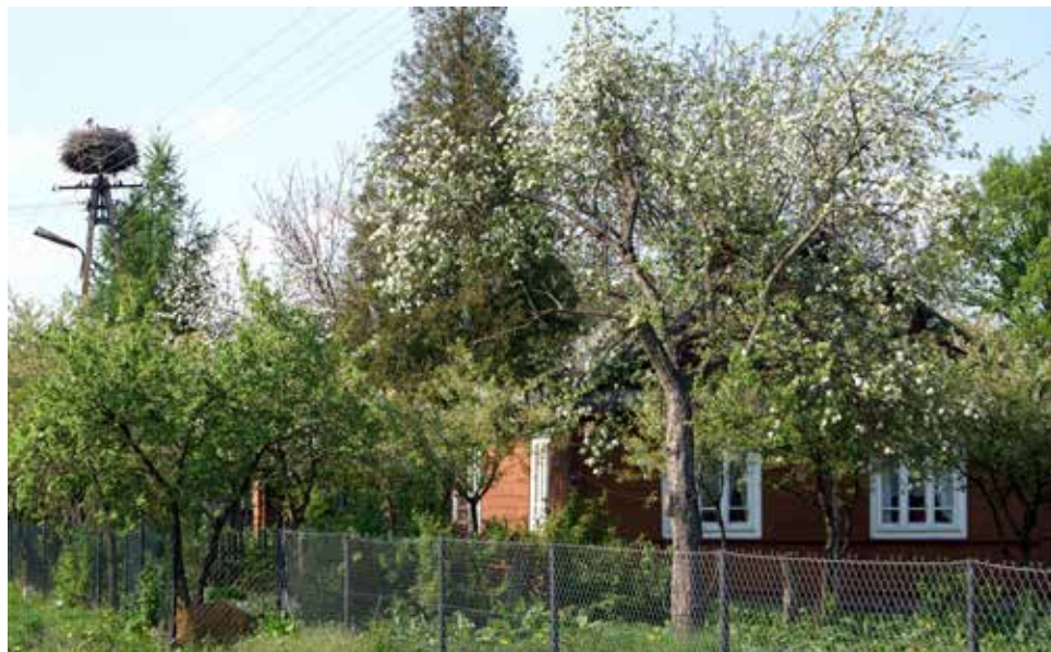
Matcze wiosną, fot. Olgierd Bielak

układ urbanistyczny dawnego miasteczka z czworobocznym rynkiem i ulicami wychodzącymi z jego naroży. Malowniczego usytuowania na skarpie doliny Bugu dopełniają zabytki: późnobarokowy poddominikański kościół pod wezwaniem św. Jacka i Matki Boskiej Różańcowej z XVIII wieku, drewniany kościół pod wezwaniem św. Mikołaja Cudotwórcy i Podwyższenia Krzyża Świętego , dawna cerkiew unicka z początku XX wieku z rokokowym ikonostasem z XVIII wieku pochodzącym z Maciejowa na Wołyniu oraz położony na cmentarzu drewniany kościół polskokatolicki pod wezwaniem Zmartwychwstania Pańskiego wzniesiony w 1933 roku. Dużej wagi historycznej nadaje temu miejscu grodzisko zwane Wałami Jagiellońskimi z pozostałościami zamku. Tu w 1413 roku doszło do podpisania unii polsko-litewskiej zwanej