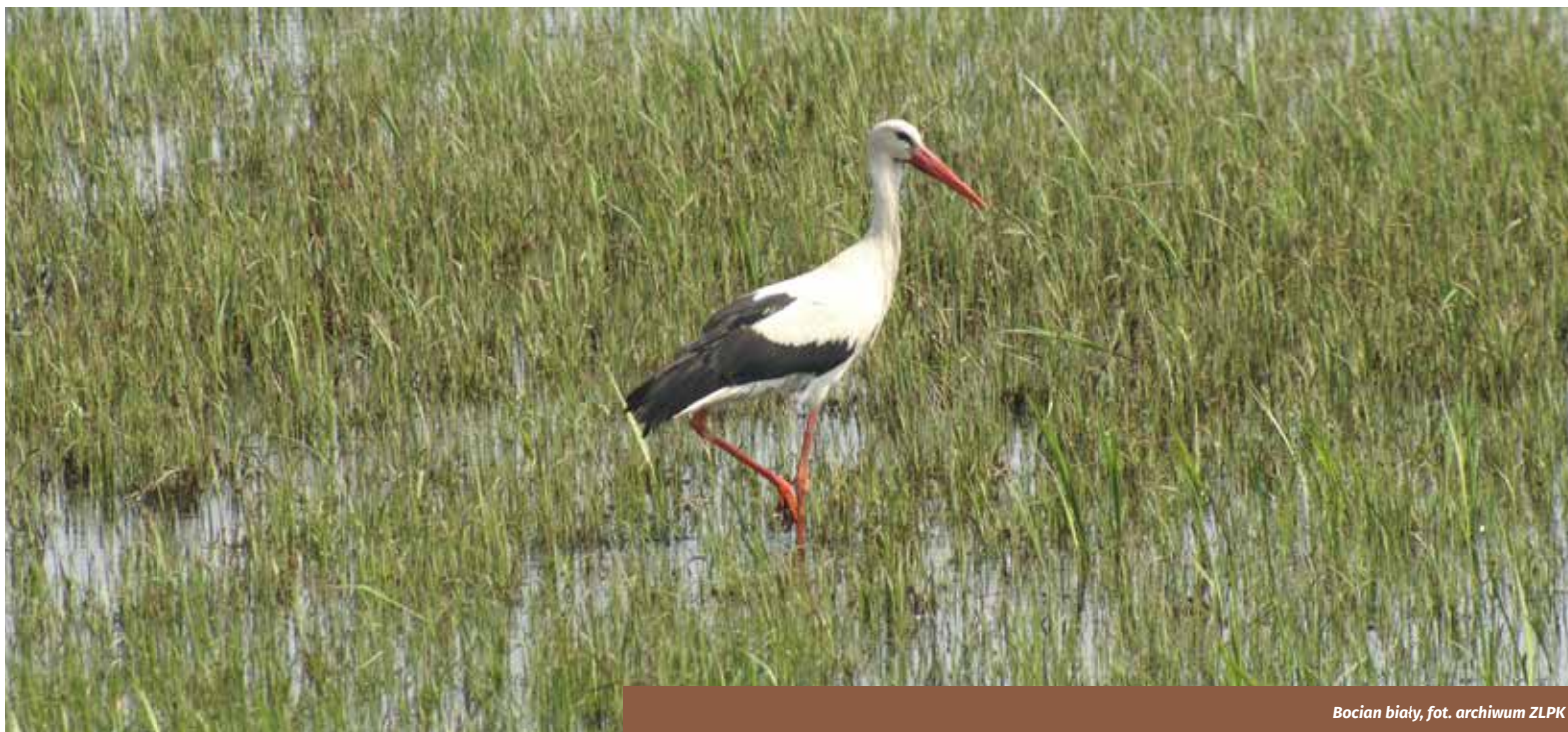
Bocian biały

Symbolem parku są orliki krzykliwe , które mają tu optymalne warunki do rozrodu. Dzięki temu w Lasach Strzeleckich znajduje się jedno z największych w Polsce lęgówisk tego gatunku. Te drapieżne ptaki zakładają gniazda wysoko na dębach lub sosnach, rzadziej na innych gatunkach drzew. Orliki krzykliwe są jednym z mniejszych gatunków orłów występujących w Europie. Ich rozpiętość skrzydeł dochodzi do 1,8 metra. Podobnie jak i reszta ptaków drapieżnych podlegają w naszym kraju ochronie prawnej, dodatkowo jeszcze wpisane są też jako gatunek rzadki do Polskiej Czerwonej Księgi Zwierząt. Wokół gniazd orlików ustanowione są strefy ochronne. Wysoka jest również liczebność puszczyków , a ich zagęszczenie w parku należy do najwyższych w Polsce. Puszczki to sowy o długości 37–46 centymetrów i rozpiętości skrzydeł 85–104 centymetrów. Mają one duże głowy z wyraźnie zaznaczoną szlarą i czarne oczy. Jest to gatunek typowo nocny. W dzień można zauważyć ptaki siedzącego w otworach dziupli, które ze względu na upierzenie doskonale zlewają się z korą drzew. Ptaki te