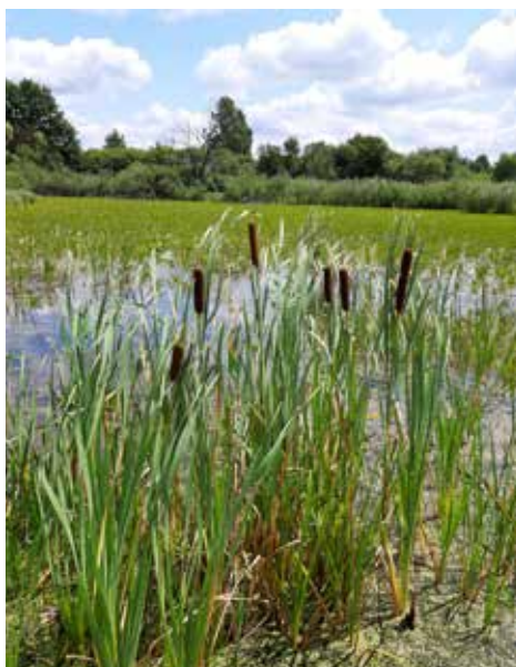
Starorzecze rzeki Bug