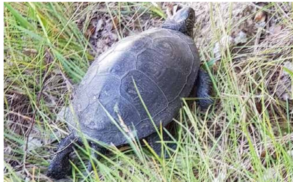
Żółw błotny w okolicy Starosiela