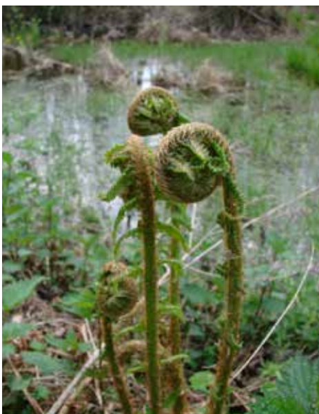
Podmokłe lasy to doskonałe siedlisko dla rozwoju paproci