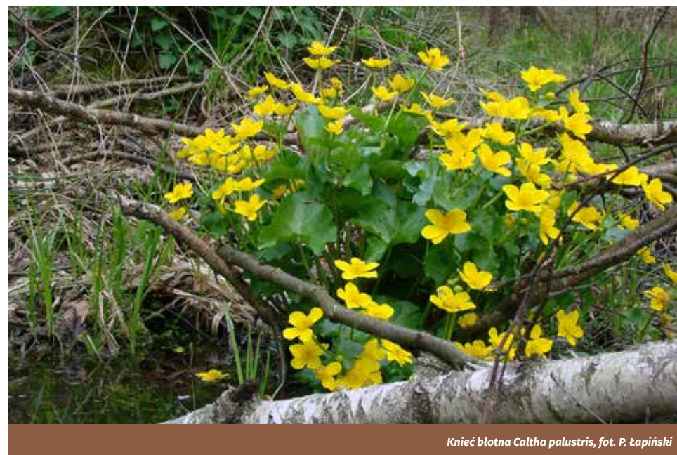
Knieć błotna Caltha palustris , fot. P. Łapiński