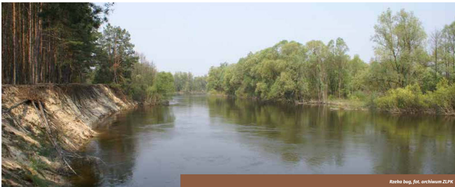
Rzeka bug