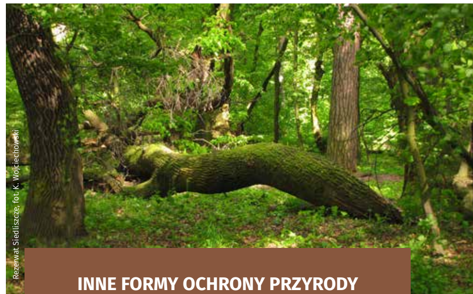
Rezerwat Siedliszcze, fot. K. Wojciechowski

Najcenniejsze fragmenty Strzeleckiego Parku Krajobrazowego o wysokich walorach przyrodniczych objęte są dodatkową ochroną prawną jako rezerwat przyrody „Siedliszcze” i „Liski”.