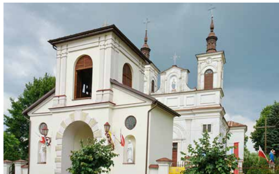
Kościół parafialny p. w. Świętej Trójcy z XIX wieku w Dubience