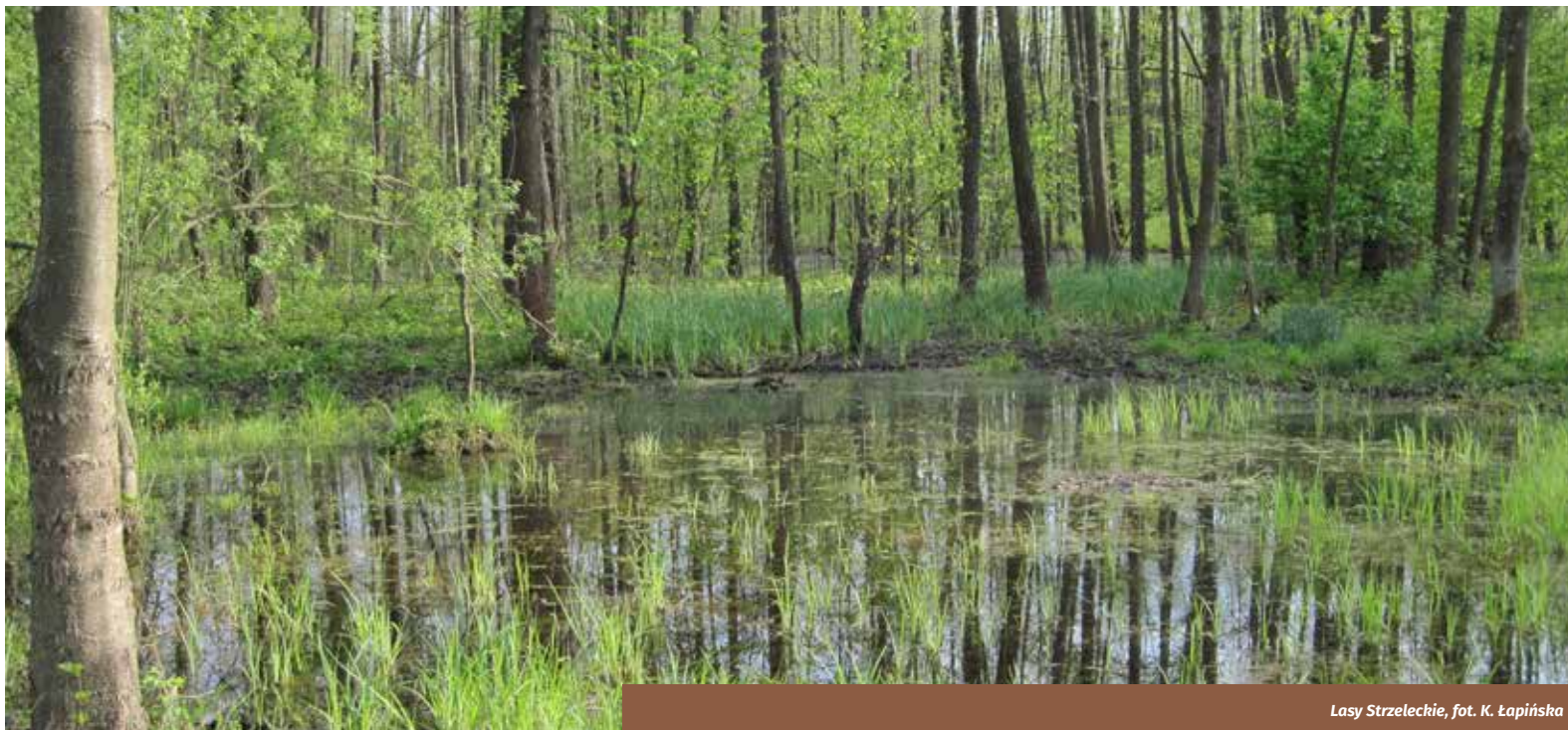
Lasy Strzeleckie

Dolina Bugu, zwłaszcza w odcinku pogranicznym, to zespół unikalnych na skalę europejską ekosystemów siedlisk flory i fauny. Cechuje ją różnorodność siedlisk i gatunków. Nasycenie obszarami chronionymi jest zadowalające w części polskiej, natomiast w części białoruskiej zdecydowanie niewystarczające. Z uwagi jednak na egzekucję prawa ochrony przyrody w Polsce wydaje się, że część białoruska jest zdecydowanie