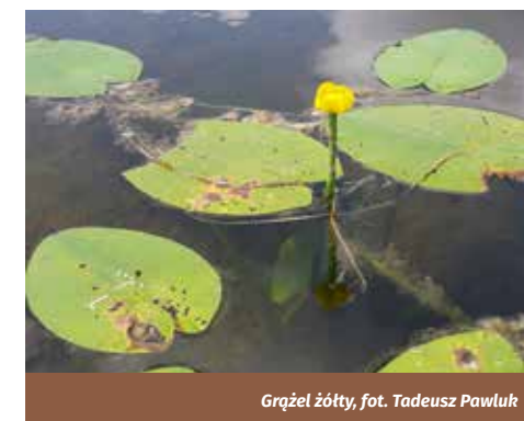
Grąźel żółty, fot. Tadeusz Pawluk

363 kilometrach stanowi granicę polsko-ukraińską, zaś ostatnie 224 kilometry płynie po terytorium Polski. Bug wpada do Narwi, choć do 1962 roku uważano go za dopływ Wisły. Bug przepływa przez szereg krain geograficznych. Wypływa z Gołogór leżących na Wyżynie Podolskiej, dalej płynie między Wyżyną Lubelską a Wołyńską, przecina Polesie Zachodnie i wpływa na Nizinę