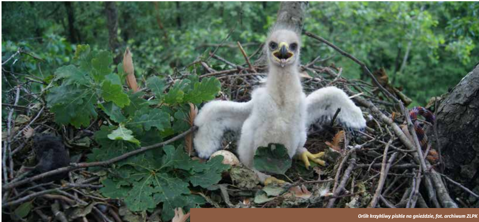
Orlik krzykliwy piskle na gnieździe

Wśród ssaków warto wymienić występowanie bobrów i wydr , a także nietoperzy takich jak borowce Leislera i nocki Bechsteina , gatunki z Polskiej Czerwonej Księgi Zwierząt, a także: borowce wielkie , mopki , nocki rude , gacki brunatne , mroczki posrebrzane , nocki Natterera , a także bardzo rzadkie chrząszcze zagąbki bruzdkowate . Wszystkie nietoperze objęte są ochroną gatunkową. Liczne są również ryjówki