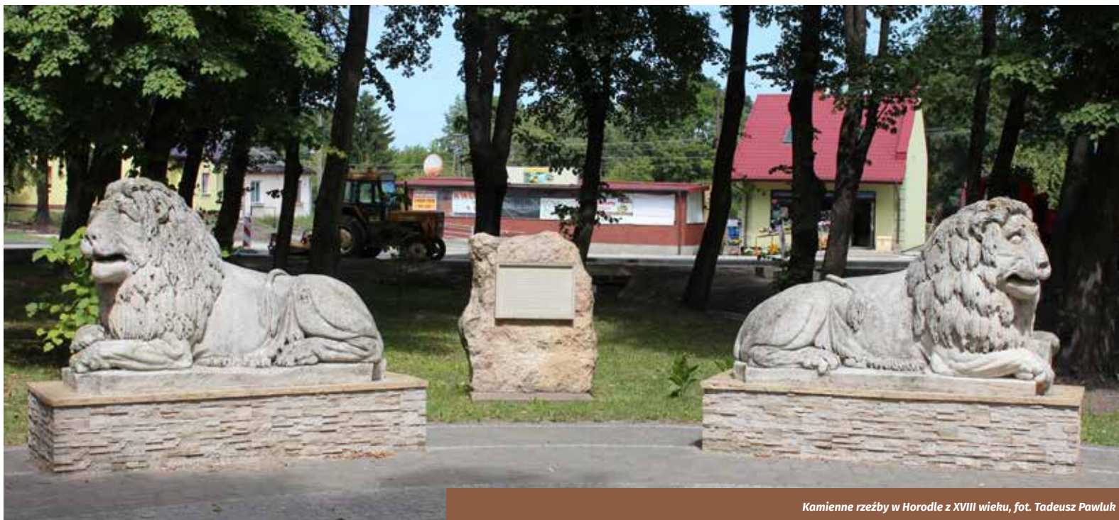
Kamienne rzeźby w Horodle z XVIII wieku

W południowej części parku, oddalona o 4 kilometry od jego granic, położona jest kolejna miejscowość gminna Horodło , o której pierwsze wzmianki pochodzą z 1287 roku. Miejscowość miała bujną historię, której świadkami są zachowane zabytkowe objekty. W Horodle zachował się