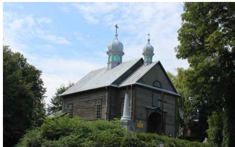
Kościół drewniany p. w. św. Mikołaja Cudotwórcy i podwyższenia Krzyża Świętego w Horodle