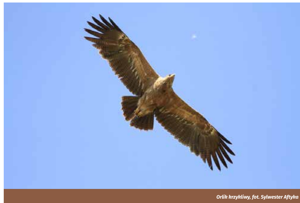
Orlik krzykliwy