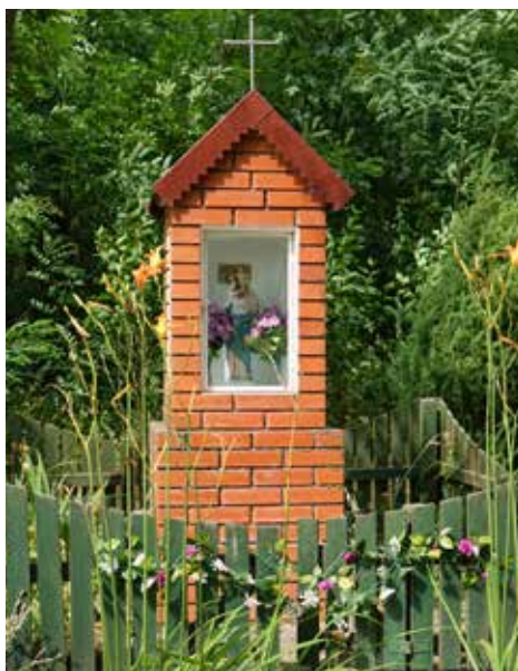
Kapliczka z Matką Boską z okolic Dubienki