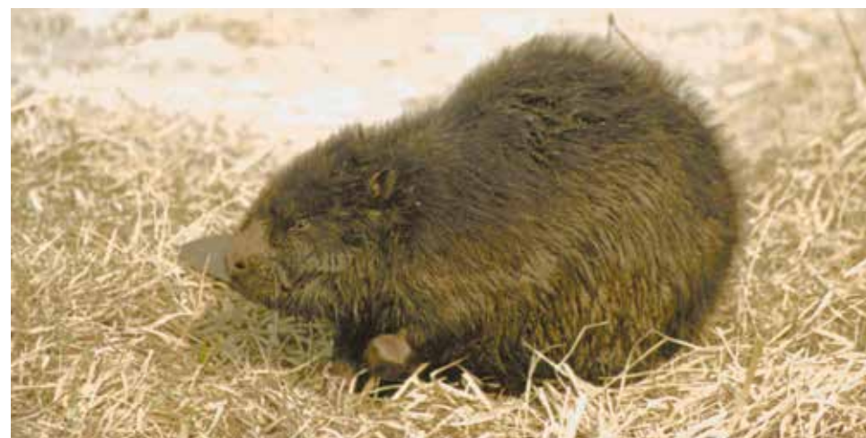
Bóbr europejski