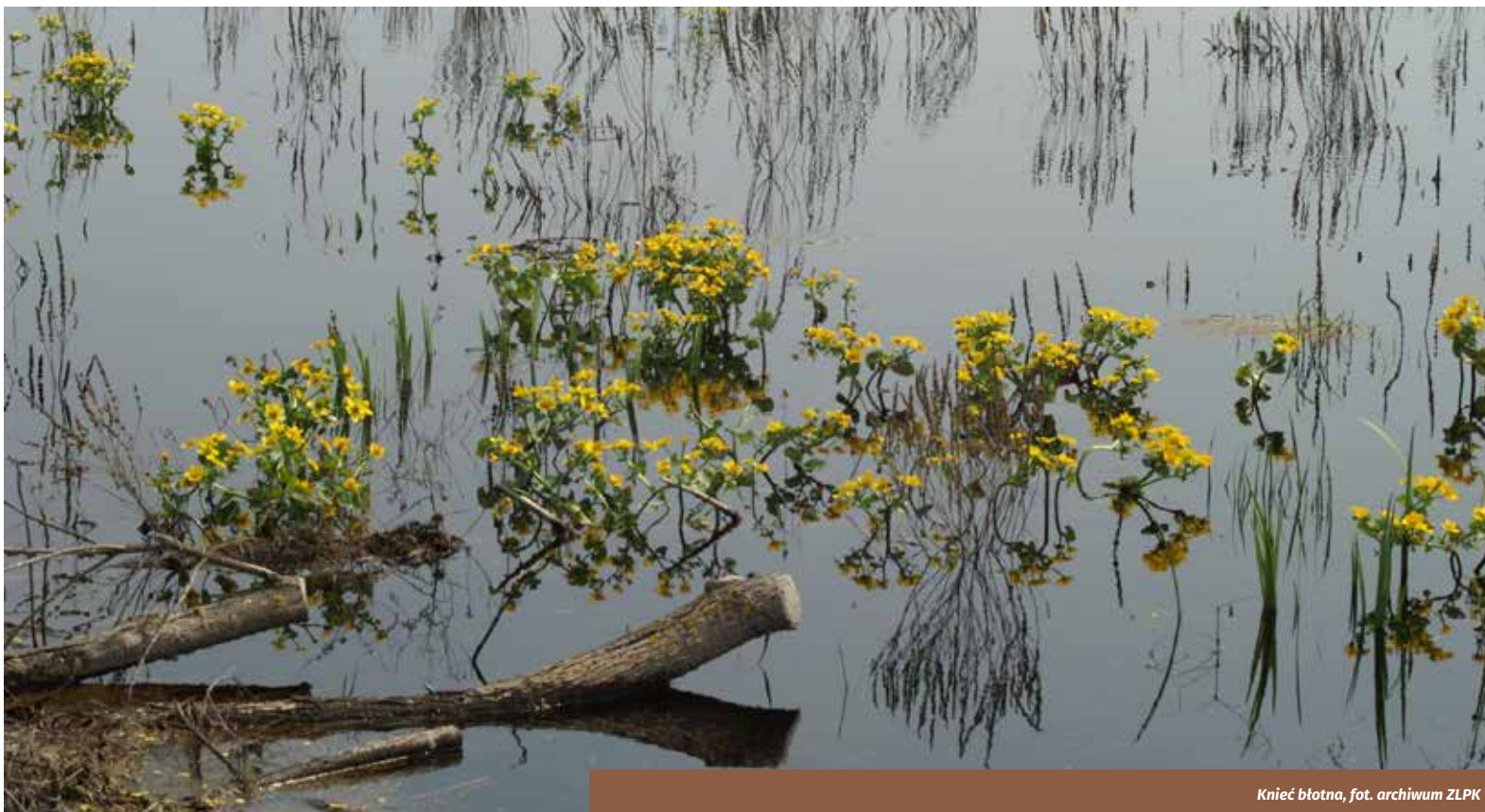
Knieć błotna

Grabowiecko-Strzelecki Obszar Chronionego Krajobrazu został utworzony w 1998 roku na podstawie Rozporządzenia Wojewody Chełmskiego nr 51 z dnia 26.06.1998 roku. Ogółem teren zajmuje powierzchnię około 26 963 hektarów. Obszar składa się z dwóch enklaw przedzielonych Skierbieszowskim Parkiem Krajobrazowym. Na terenie gminy Krasnystaw zajmuje swym zasięgiem całą południową część gminy oraz w części północnej dolinę rzeki Wieprz. Jest to niezwykle malowniczy teren Wyniosłości Giełczewskiej i Działów Grabowieckich o bardzo dużych walorach krajobrazowych, odznaczający się urozmaiconą rzeźbą terenu w postaci suchych dolinek i wąwozów oraz okazami rzadkiej roślinności. Jest to obszar o dużych walorach widokowych.