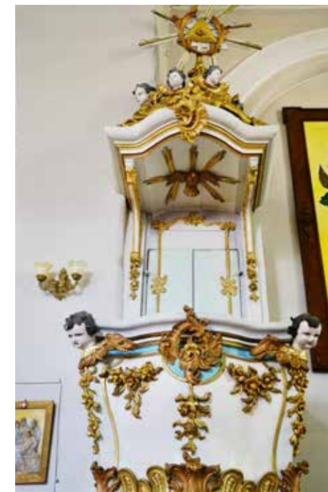
Barokowa ambona w kościele w Dubience