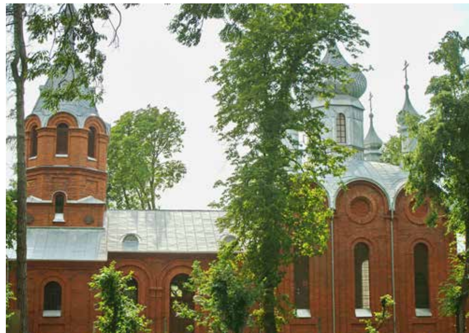
Bizantyjska-ruska murowana cerkiew z XIX w. w Dubience