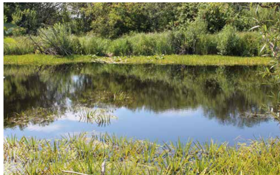
Podmokłe łąki