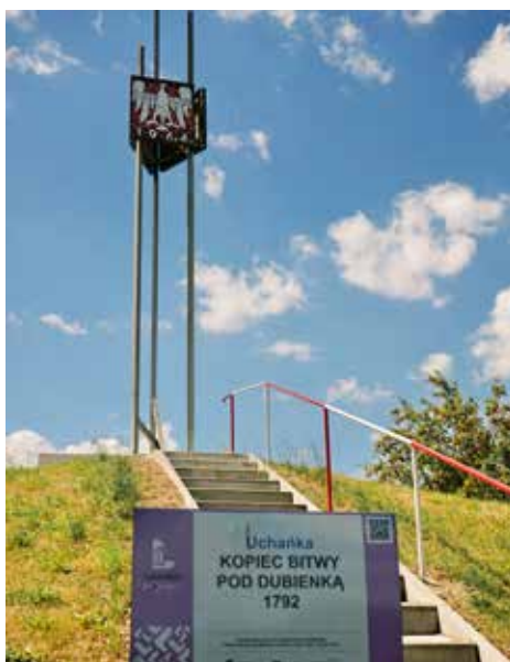
Kopiec bitwy pod Dubienką, fot. Andrzej Brzeziecki