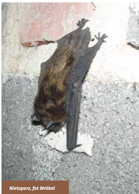
Nietoperz, fot. Wróbel