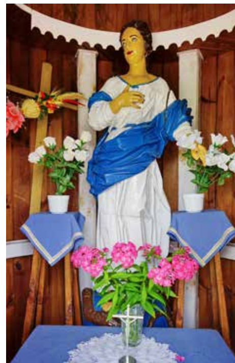
Drewninna rzeźba w kapliczce w Skryhiczynie