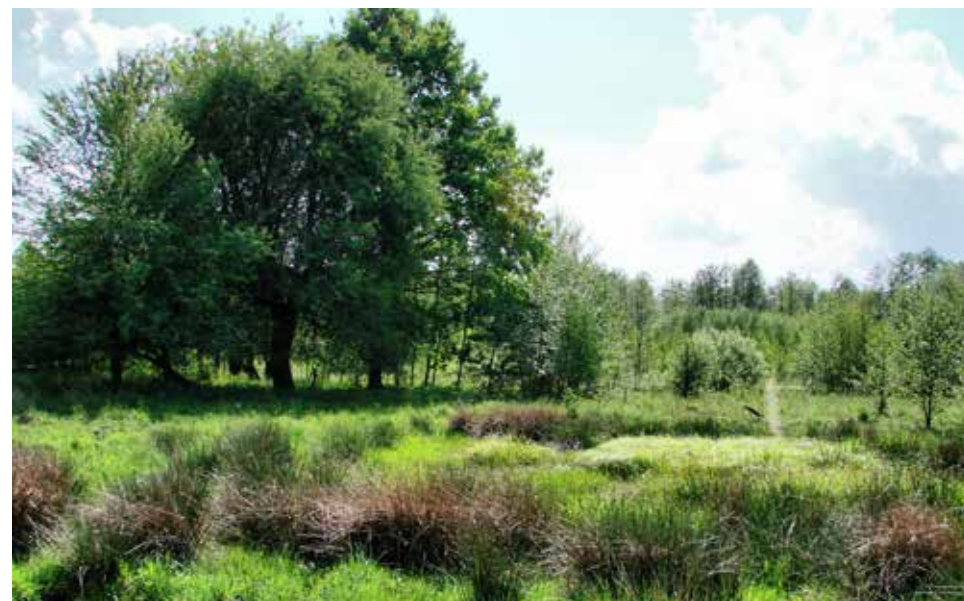
Podmokłe łąki