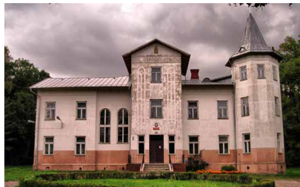
Pałac myśliwski Zamoyskich z pocz. XX wieku w Maziarni Strzeleckiej

Jednym z najcenniejszych zabytków na terenie parku jest Pałac Myśliwski Zamoyskich w Maziarni Strzeleckiej . Pierwsze informacje o dobrach strzeleckich, będących własnością królewską, pochodzą z 1628 roku. W 1834 roku nabył je Józef Łżycki, funkcjonowała tu wówczas osada leśna pod nazwą Nowa Maziarnia . W 1875 roku właścicielem