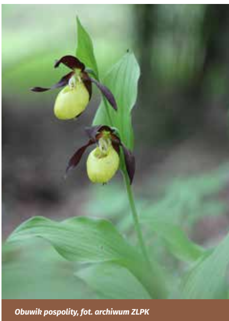
Obuwik pospolity