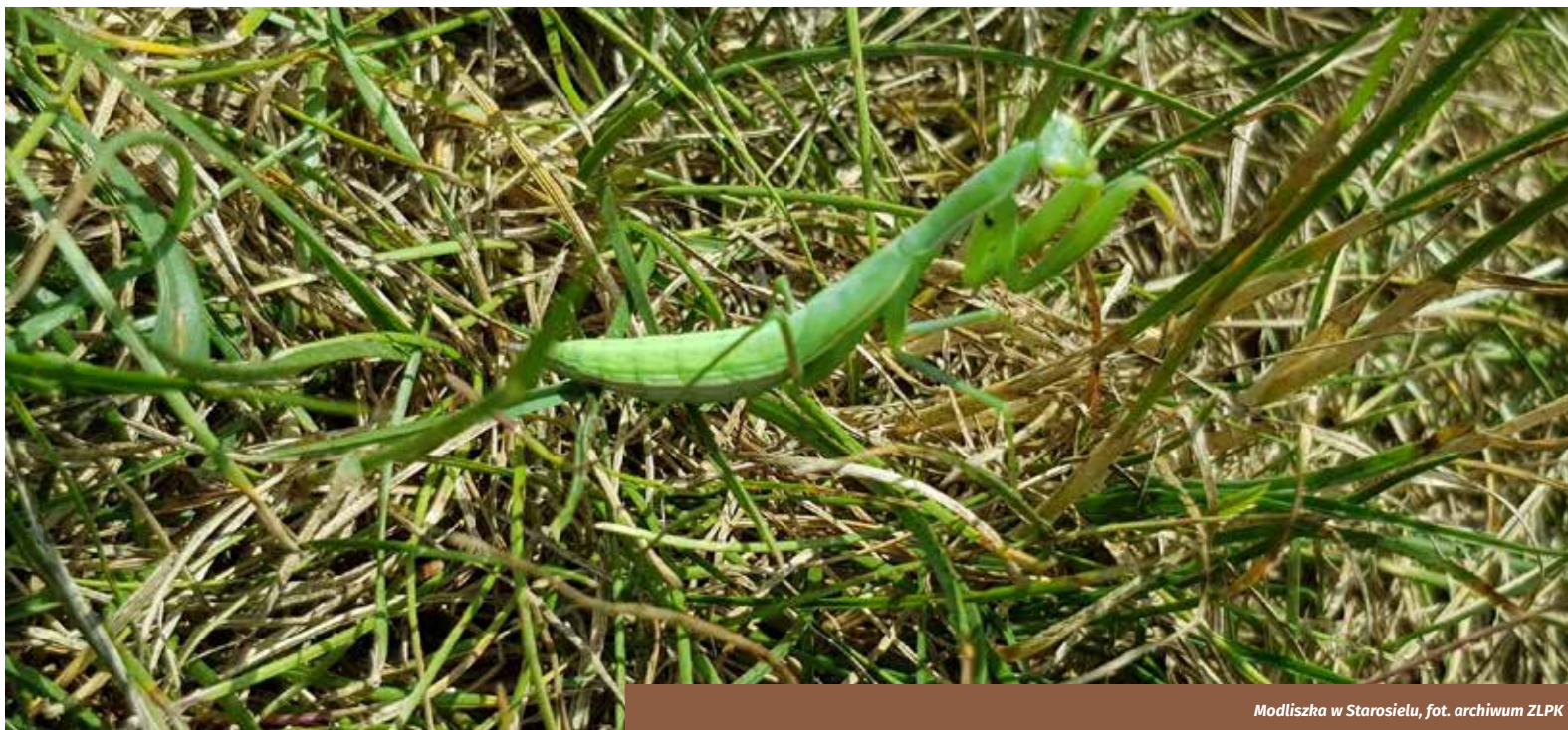
Modliszka w Starosielu

Obszar położony jest we wschodniej Polsce, na Polesiu Zachodnim. Obejmuje on sześć odcinków doliny rzeki Bug między Sławatyczami a Dubienką. Ostoja przebiega wzdłuż polsko-ukraińskiej granicy. W ostoi znalazła się lewobrzeżna (polska) część doliny. W skład obszaru wchodzi najcenniejsze przyrodniczo i szczególnie atrakcyjne krajoznawczo odcinki doliny środkowego Bugu. Dolina Bugu jest jedną z niewielu dolin dużych rzek europejskich, która zachowała tak naturalny charakter. O jej naturalności świadczą liczne meandry i starorzecza oraz dobrze zachowane siedliska związane z dolinami rzecznyymi. W dolinie Bugu znajdują się rozległe, ekstensywnie użytkowane łąki, wśród których spotyka się łagodne, piaszczyste wzniesienia z murawami ciepłolubnymi. Natomiast obniżenia terenu porastają płaty łągów i zarośli wierzbowo-topolowych. Zidentyfikowano tu sześć rodzajów siedlisk cennych dla przyrody europejskiej, które zajmują w sumie 66% obszaru. Wśród nich największą powierzchnię zajmują ekstensywnie użytkowane łąki (30%) oraz starorzecza (12%). Obszar obejmuje także miejsca bytowania wielu gatunków owadów, płazów i drobnych ssaków, występujących