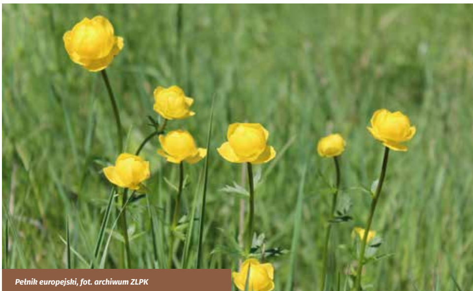
Pełnik europejski, fot. archiwum ZLPK

i wielopiętrowość. Dominującym zbiorowiskiem jest grąd subkontynentalny w odmianie wołyńskiej. Charakterystycznym gatunkiem runa lasów parku jest barwinek pospolity . W runie strzeleckich lasów spotkać można jednego z piękniejszych polskich storczyków – obuwika pospolitego . Wśród rzadkich gatunków roślin na terenie parku występują: buławnik wielkokwiatowy i czerwony, mieczyk dachówkowaty i liłia złotogłów . Jest to również miejsce występowania naparstnicy zwyczajnej . Okazałą rośliną w tutejszych lasach jest parzydło leśne osiągające wysokość do 2 metrów oraz pluskwica europejska . Charakterystyczną rośliną jest wczesnowiosenny piewiosnek wyniosły , uznawany za element górski. Las charakteryzuje się występowaniem tak zwanej sosny matczańskiej , która stanowi lokalny ekotyp sosny zwyczajnej i cechuje się dachówkowato ułożoną korą. W miejscu liczного występowania sosny matczańskiej