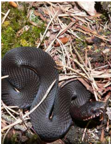
Żmija Vipera berus