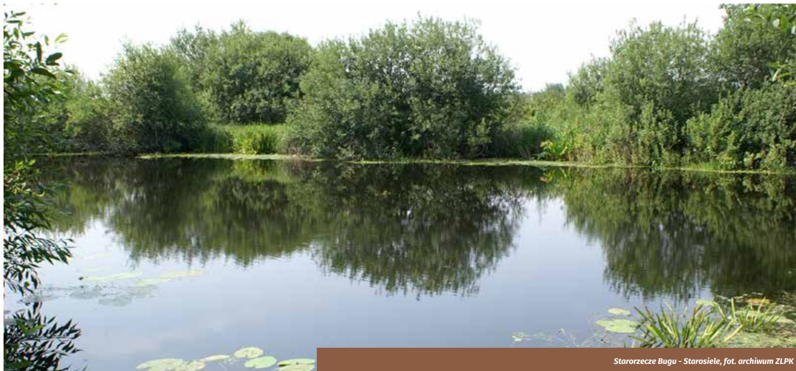
Starorzecze Bugu - Starosiele

Obszar położony jest w południowej części Obniżenia Dubienki w sąsiedztwie doliny Bugu i obejmuje najcenniejsze przyrodniczo fragmenty kompleksu leśnego Lasów Strzeleckich wraz z przylegającymi terenami łąkowymi. Został on wyznaczony w celu ochrony bardzo licznych populacji motyli przeplatki maturalny i czerwończyka fioletka, oraz typowo wykształconych grądów subkontynentalnych w odmianie wotyńskiej.