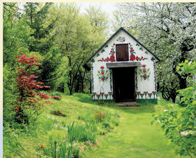
Skansen w Zaburzu.