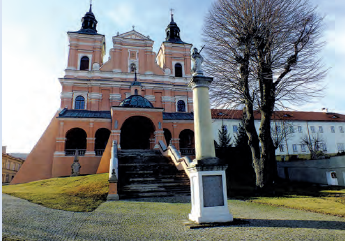
Bazylika św. Antoniego Padewskiego w Radecznicy.

Najcenniejszy zespół zabytkowy znajduje się w Szczepieszynie i okolicach. Zachował się tutaj średniowieczny układ urbanistyczny, ruiny zamku z XVI wieku, grupa cennych XVI-wiecznych obiektów sakralnych: kościół parafialny, kościół i klasztor dominikanów, cerkiew prawosławna i synagoga, kilkadziesiąt domów mieszkalnych z XVIII i XIX wieku oraz duży zespół pałacowy rezydencji Zamoyckich z ogromnym parkiem w Klemensowie. W Radecznicy zachował się zabytkowy XVII-wieczny kościół i klasztor bernardynów, który stanowi ośrodek kultu św. Antoniego i jest miejscem, do którego zbiegają pielgrzymki wiernych. W miejscowości Sąsiadka znajduje się grodzisko, będące