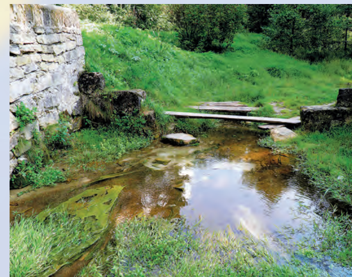
Źródliko w Trzęsinach – pomnik przyrody nieożywionej.