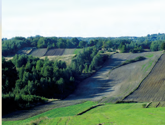
Rolniczy krajobraz Szczepreszyńskiego Parku Krajobrazowego.