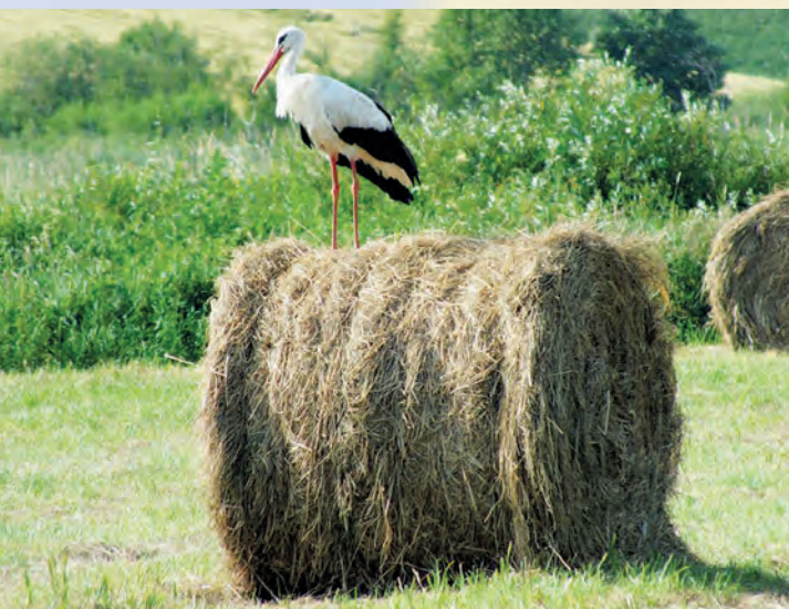
Bocian biały Ciconia ciconia – charakterystyczny element krajobrazu rolniczego.

Interesującą grupą bezkręgowców, występującą w okolicach Szczepreszyna, są krocionogi, a zwłaszcza ich gatunki górskie. W granicach Parku nie ma rezerwatów przyrody, są jedynie pomniki przyrody, z których najciekawsze to: kilkusetletnia lipa w Szperówce oraz źródła w dolinie Poru w Zaporzu.