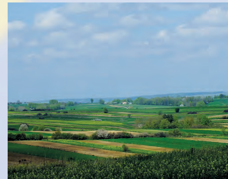
Charakterystyczny krajobraz Szczepieszynskiego Parku Krajobrazowego.

Najcenniejszymi zbiorowiskami leśnymi są: buczyna karpacka, porastająca zbocza wzniesień i głębokich jarów, oraz bór jodłowy, występujący w dolnych partiach zboczy oraz w obniżeniach pomiędzy wzniesieniami. Nasłonecznione zbocza wzgórz i wąwozów pokrywają zbiorowiska roślinności kserotermicznej. Największe ich powierzchnie spotyka się w okolicach Zakłodzia, Kawęczynka oraz na południowy zachód od Szczepieszyna. Interesujące jest także torfowisko wysokie na Bagnie Tałandy, porośnięte karłowatą sosną i brzozą omszoną.