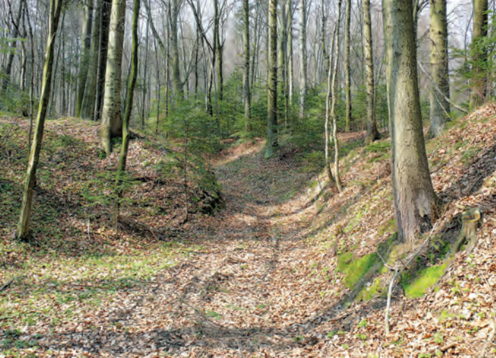
Las Cetnar jesienią.