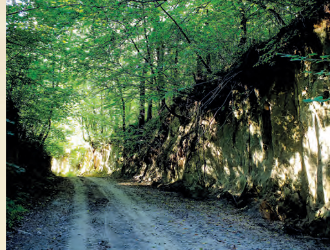
Wąwóz lessowy w Szczepreszyńskim Parku Krajobrazowym.