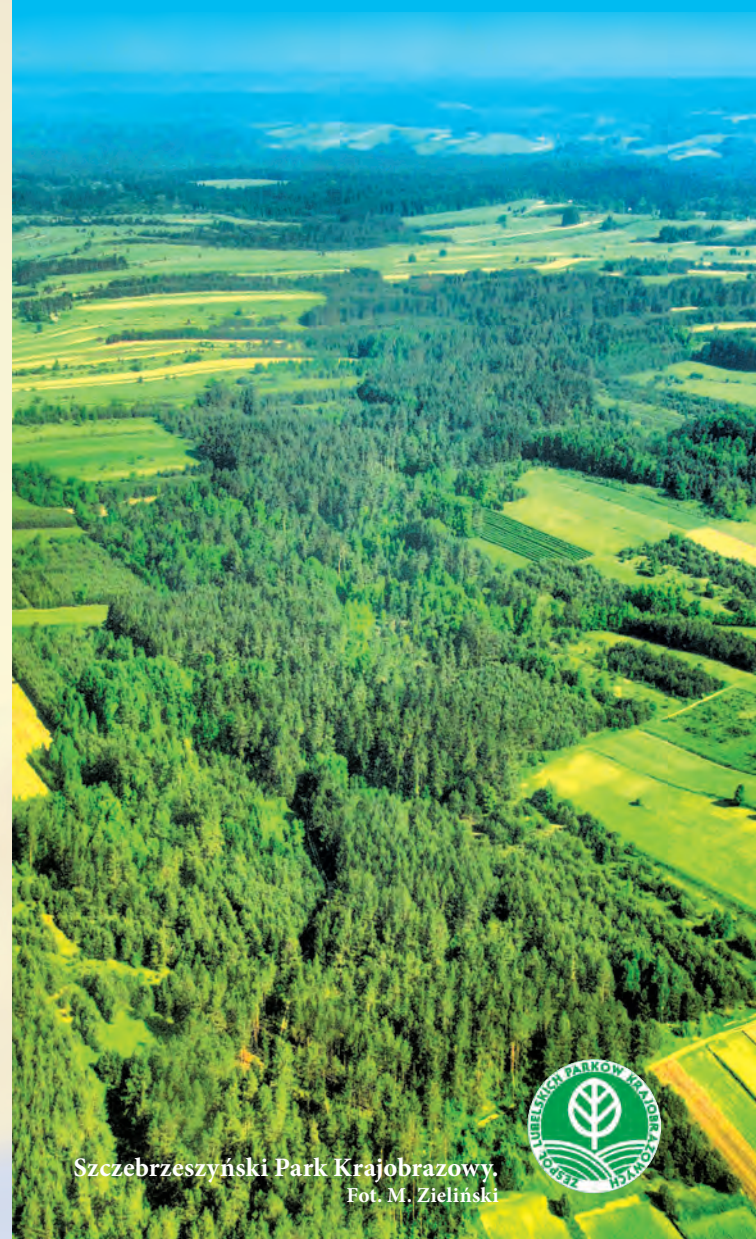
Szczepieszynski Park Krajobrazowy.