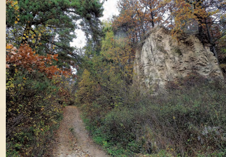
Skarpa Lessowa w Kawęczynie.

Na obszarze Parku w dużych ilościach występują rośliny ciepłolubne, wśród których jest wiele gatunków roślin rzadko spotykanych, jak: szczodrzeniec ruski, pluskwica europejska, zawilec wielkokwiatowy, miodunka miękkowłosa, dzwonek syberyjski, rutewka mniejsza, leniec pospolity, szaflwia łąkowa, powojnik prosty, koniczyna pagórkowata i kłosownica pierzasta. Do tej grupy zaliczają się także gatunki górskie: