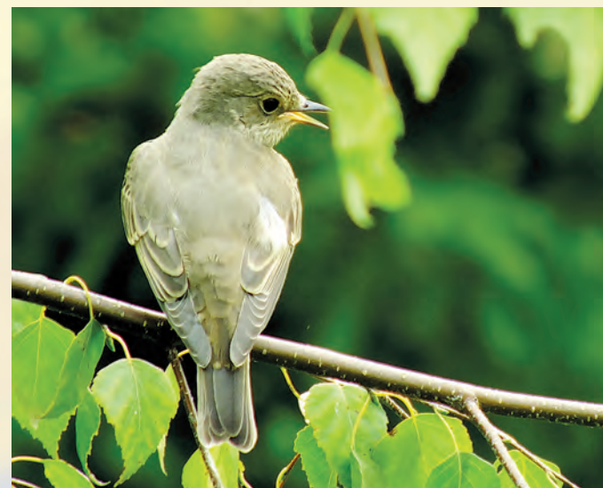
Muchołówka szara Muscicapa striata .