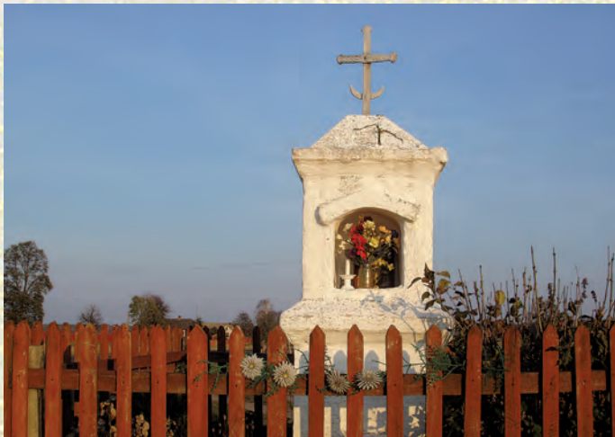
Przydrożna kapliczka w miejscowości Luta.

Obecne wsie zachowały dawny układ i rozmieszczenie siedlisk, a w zabudowie nadal, jak przed wojną, dominują drewniane chałupy, którym gdzieś towarzyszą studzienne żurawie. Drewnianą zabudowę wiejską można podziwiać w Sobiborze, Żłobku Dużym, Żłobku Małym, Macoszynie, Osowie, Stulnie, Kosyniu i Zbereżu. Na rozstajach dróg lub w miejscach upamiętniających lokalne wydarzenia stoją kapliczki i krzyże przydrożne. Liczba tych obiektów świadczy o głębokiej wierze dawnych, ale także obecnych mieszkańców tych okolic. Tragiczną pamiątką II wojny światowej jest miejsce nieopodal Sobiboru, przy linii kolejowej z Chełma do Włodawy, gdzie funkcjonował niemiecki obóz zagłady. Straciło w nim życie około 250 tys. ludzi – głównie Żydów z Polski, Rosji, Niemiec i Holandii. 14 października 1943 roku w obozie wybuchł bunt pod przywództwem radzieckiego oficera Aleksandra Peczerskiego. W wyniku buntu z obozu udało się uciec około trzystu więźniom. Po buncie zbrojnym więźniów, Niemcy zdecydowali się na likwidację obozu.