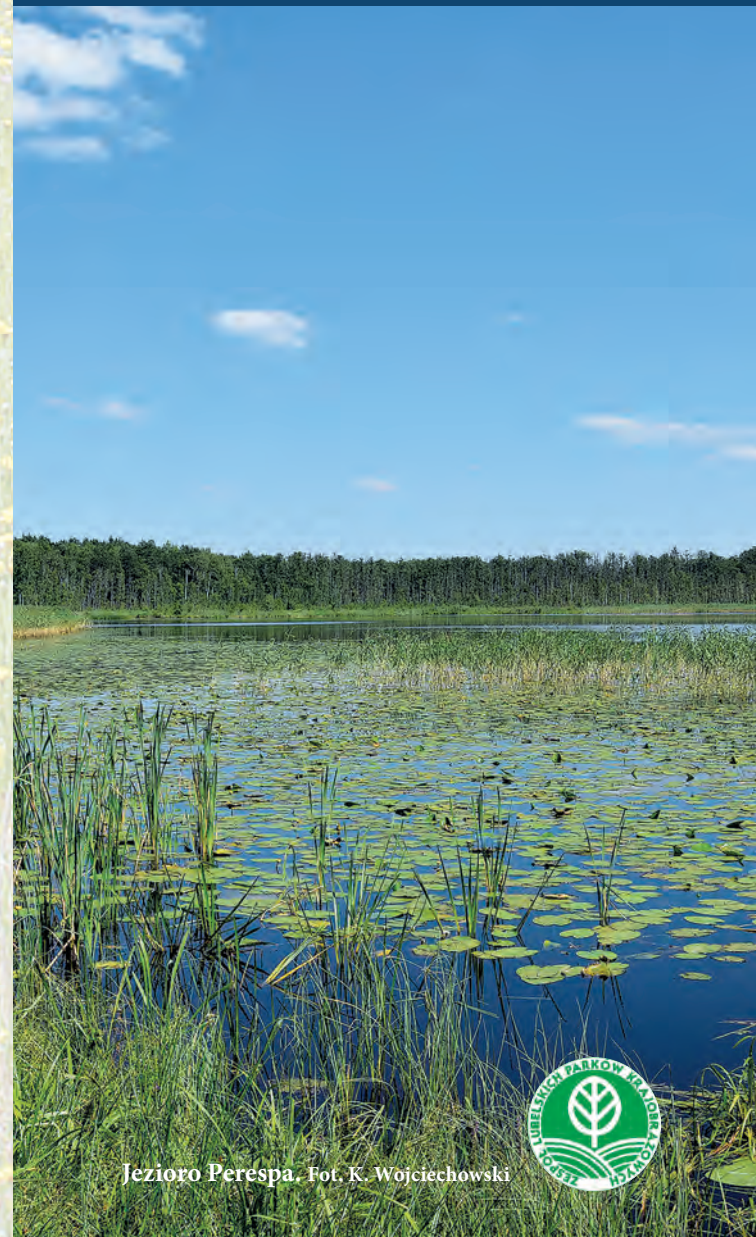
Jezioro Perespa.