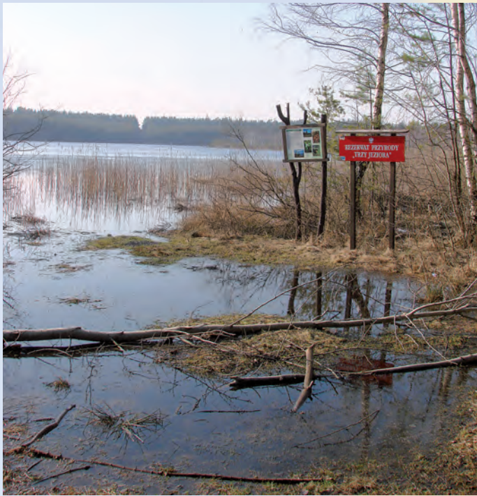
Jezioro Płotycze.

Niewielki stopień przekształcenia środowiska, trudno dostępny teren oraz duże zróżnicowanie warunków siedliskowych decydują o bogactwie faunistycznym par-