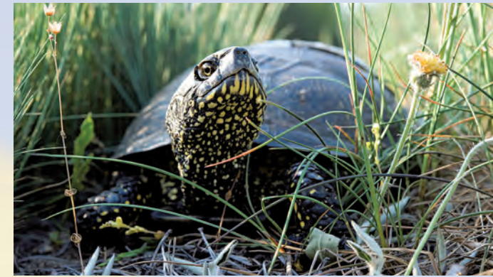
Żółw błotny Emys orbicularis . A. Sidor

mie maja i czerwca dorosłe samice opuszczają zbiorniki wodne, aby złożyć jaja w wykopanych przez nie zagłębieniach na piaszczystych polanach. Okres inkubacji trwa około 3 miesiące. Młode żółwie, po opuszczeniu gniazd, wędrują do zbiorników wodnych. Na terenie Parku prowadzony jest program ochrony żółwia, polegający na aktywnej ochronie lęgowisk.