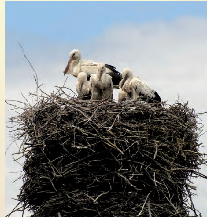
Bociany białe Ciconia Ciconia .

Wśród gadów na szczególną uwagę zasługuje żółw błotny. Jest gatunkiem zagrożonym w skali Europy, wpisanym do Polskiej Czerwonej Księgi Zwierząt, jako gatunek zagrożony wymarciem. W Sobiborskim Parku Krajobrazowym znajduje się jego największa udokumentowana populacja, która liczy około 500 osobników dorosłych. Żółw błotny występuje w niewielkich zbiornikach wodnych, jeziorach, stawach, dołach potorfowych. Na przeło-