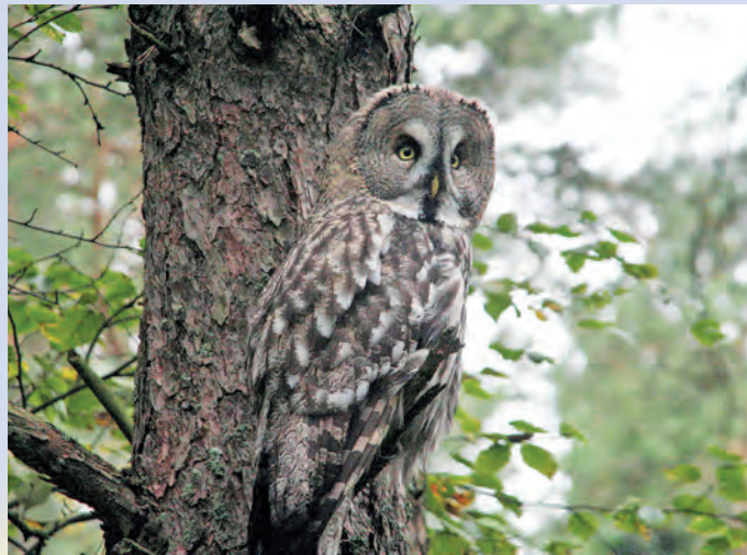
Puszczyk mszarny Stix nebulosa .

ku. W wyniku dużego zróżnicowania siedlisk w Lasach Sobiborskich wykształciła się bogata gatunkowo fauna. Wśród bezkręgowców znajdują się rzadkie gatunki motyli: przeplatka aurinia, paż królowej, mieniak strużnik, mieniak tęczowiec, modraszek telejus i modraszek nausitous, których obecność świadczy o naturalności ekosystemów leśnych i torfowiskowych. Ponadto została stwierdzona liczna populacja raka stawowego w Jeziorze Płotycze, co świadczy o wysokiej czystości tego zbiornika wodnego. W wyniku dużego bogactwa jezior i cieków wodnych na terenie nadleśnictwa możemy obserwować dosyć liczną ichtiofaunę. Na uwagę zasługuje występowanie w rzece Tarasience strzebli błotnej – gatunku znajdującego się na czerwonej liście ginących zwierząt Europy. Podmokłe tereny, liczne zbiorniki wodne stanowią dogodne miejsce bytowania płazów. Do najrzadszych, stwierdzonych na terenie Parku należą: traszka grzebieniasta, ropucha paskówka i ropucha zielona. W awifaunie Parku znajdują się gatunki objęte ochroną strefową: bocian czarny oraz puchacz. Spośród ptaków szponiastych występują tu: bielik i orlik krzykliwy. Kolejnymi rzadkimi gatunkami ptaków, jakie możemy spotkać w Lasach Sobiborskich są: bąk, jarząbek, siniak, włochatka (drugie stwierdzenie na Lubelszczyźnie), lelek, dzięcioł białogrzioty, dzięcioł czarny,