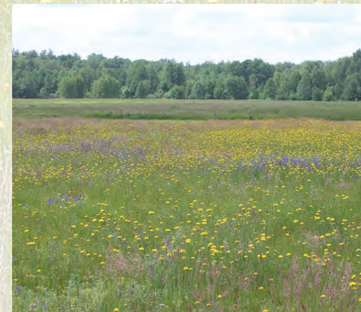
Łąki w okolicy Żłobka Małego.

Sobiborski Park Krajobrazowy jest typowym parkiem leśnym – lasy zajmują 75% jego powierzchni. Są to głównie lasy sosnowe, zróżnicowane pod względem warunków siedliskowych. W zależności od wzrostu wilgotności podłoża spotykamy bory suche, bory świeże, bory wilgotne i bory bagienne. Wyjątkiem na siedliskach borowych, w których sosna ma niewielki udział, jest brzezina bagienna, gdzie dominują: brzoza omszona i olcha czarna. Liściaste lasy grądowe zajmują niewielką powierzchnię, większe płaty spotykamy jedynie w południowej części Parku.