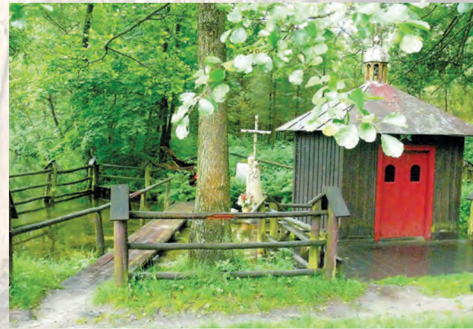
Kapliczka św. Mikołaja.