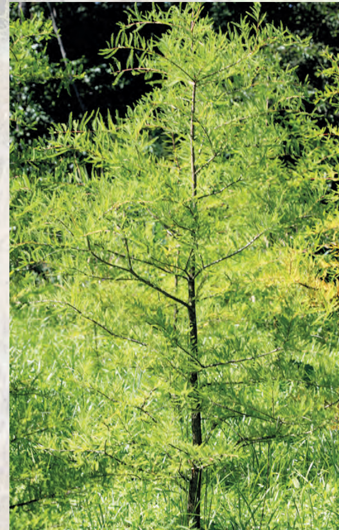
Cyprysyk błotny Taxodium distichum .

Bardzo bogaty jest świat zwierzęcy. Wśród awifauny Południoworoztoczańskiego Parku Krajobrazowego spotkać można takie gatunki jak: orlik krzykliwy, puszczyk uralski, bocian czarny, przepiórka, dudek. Większe ssaki reprezentują: łoś, jelen, dzik i sarna. Z ssaków drapieżnych warto wymienić: wilka i rysia. Na uwagę zasługuje występowanie kilku gatunków rzadkich owadów, takich jak: modliszka, mieniak tęczowiec, nadobnica alpejska oraz ciepłolubne gatunki mrówek.