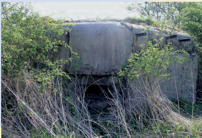
Jeden z bunkrów z Linii Mołotowa.

Południoworoztoczański Park Krajobrazowy to wymarzona okolica do uprawiania turystyki kwalifikowanej: pieszej i rowerowej. Tereny te są jednak dzikie i odludne, należy więc pamiętać o mapie i kompasie oraz odpowiednim przygotowaniu kondycyjnym. Roztoczańskie krajobrazy wynagrodzą z nawiązką trudy wędrówki. Pomocne w wędrówce mogą być znakowane szlaki piesze, rowerowe (m.in. końcowy fragment polskiego odcinka Centralnego Szlaku Rowerowego Roztocza) oraz wytyczone ścieżki dydaktyczne.