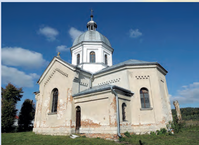
Cerkiew w Siedliskach.