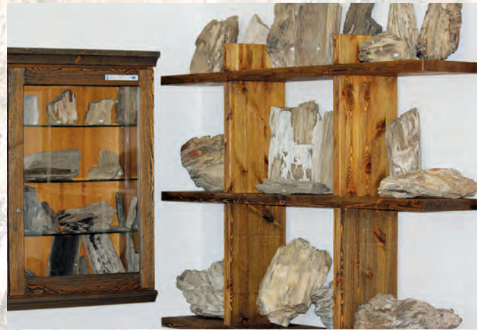
Okazy skamieniałych drzew w Muzeum w Siedliskach.