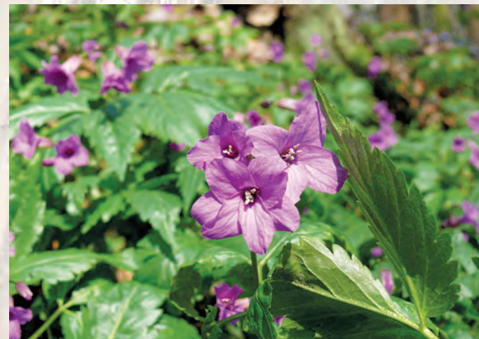
Żywiec gruczołowaty Cardamine glanduligera .