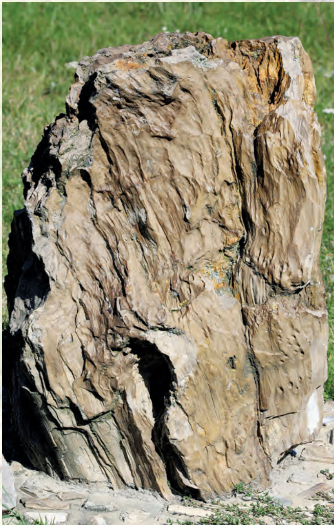
Fragment skamieniałego drzewa.