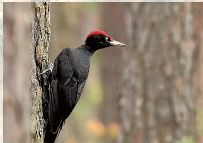
Dzięcioł czarny Dryocopus martius .