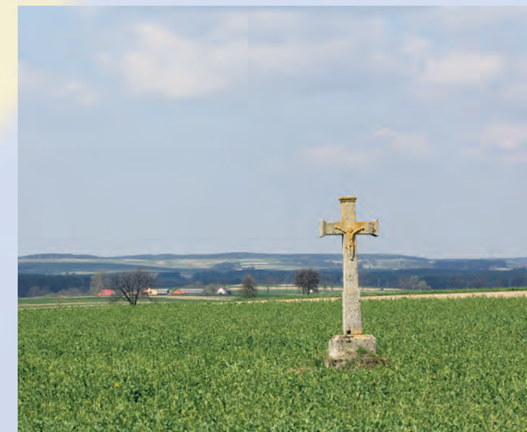
Krzyż bruśnieński - charakterystyczny element krajobrazu Południoworoztoczańskiego Parku Krajobrazowego.

Okolo 67% powierzchni Parku porastają lasy. Grzbiety i zbocza wyższych wzniesień zajmują, charakterystyczne dla Roztocza, zbiorowiska buczyny karpackiej. W runie buczyn spotkać można wiele rzadkich roślin górskich m.in.: czosnek niedźwiedzi, żywiec gruczołkowaty, przetacznik górski, lulecznicę kraińską czy sałatnicę leśną. Większość pozostałych lasów to wtórne bory sosnowe. Porastające tereny porolne w miejscu dawnych pól i wysiedlonych wsi ukraińskich.