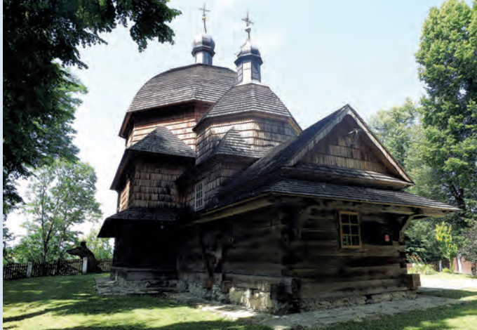
Cerkiew w Hrebennem.