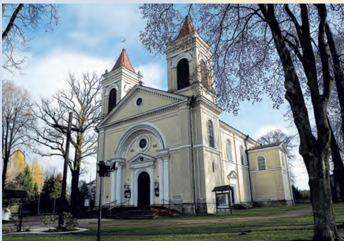
Kościół w Józefowie.