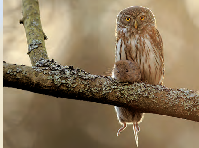
Sóweczka Glaucidium passerinum .