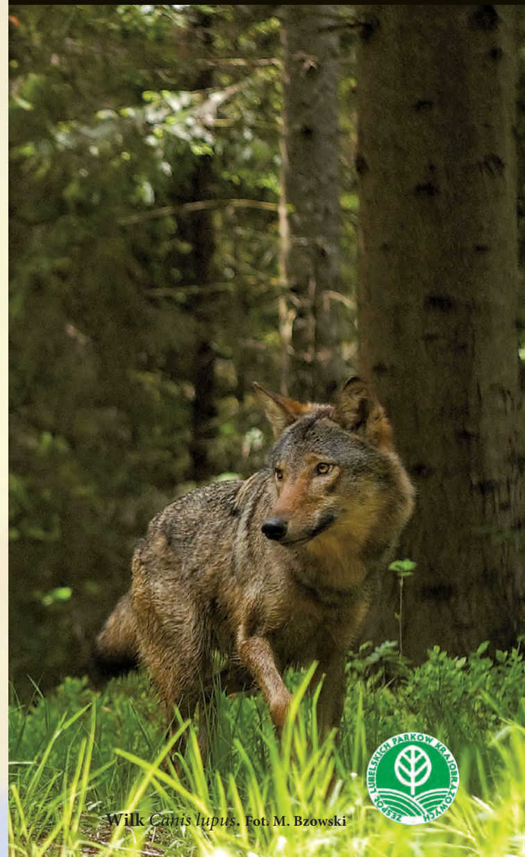
Wilk Canis lupus .