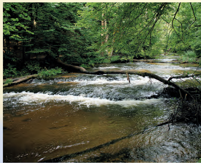
Rezerwat Nad Tanwią.