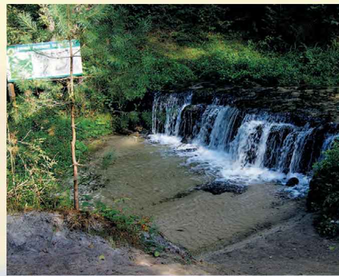
Wodospad na rzece Jeleń.