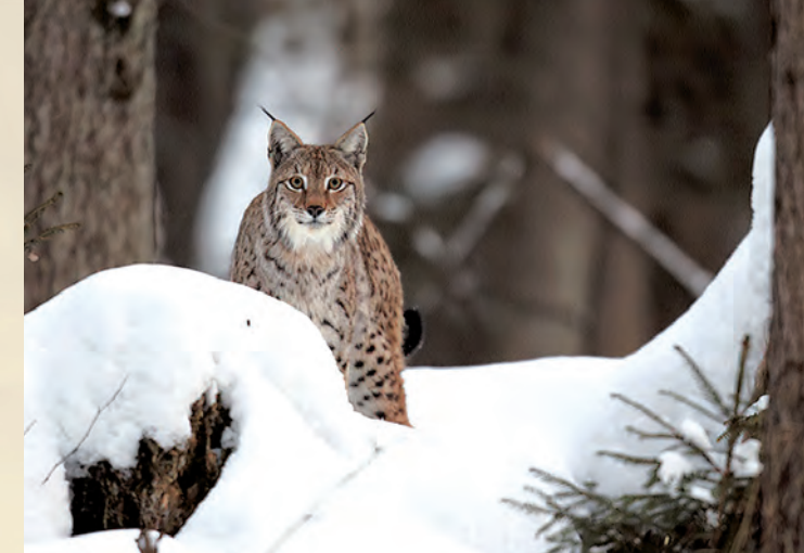
Ryś Lynx lynx .

Bogata jest również fauna tego obszaru. W zimnych i czystych wodach potoków Parku żyją dwa cenne, również dla wędkarzy gatunki ryb: pstrąg potokowy i lipień. Górne odcinki biegu strumieni przyjęto nazywać „kraią pstrąga i lipienia”. Z awifauny na terenie Parku zanotowano gatunki zagrożone w skali globalnej: podgorzałkę i głuszca. Do najbardziej charakterystycznych i jednocześnie najcenniejszych gatun-