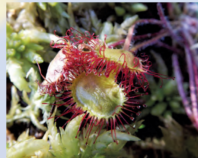
Rosiczka okrągłolistna Drosera rotundifolia .