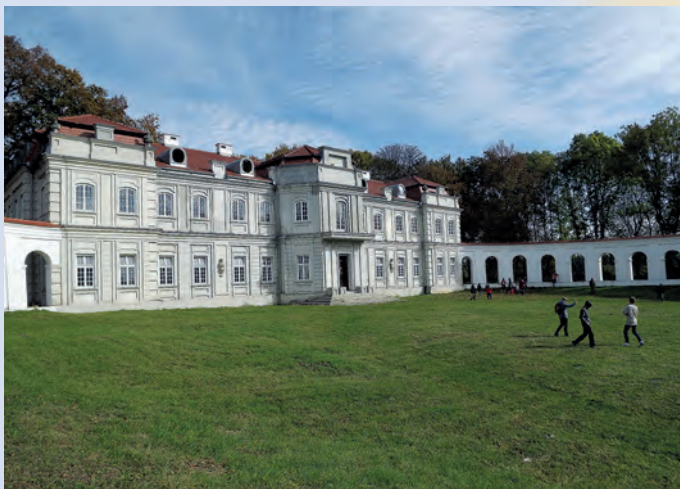
Pałac Łosiów w Narolu.

Park Krajobrazowy Puszczy Solskiej jest chętnie odwiedzany przez turystów. Bazą wypadową do wycieczek są popularne miejscowości wypoczynkowe: Susiec, Józefów i Narol.