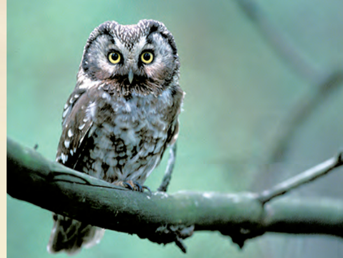
Włochatka Aegolius funereus .