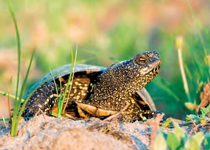
Żółw błotny Emys orbicularis .