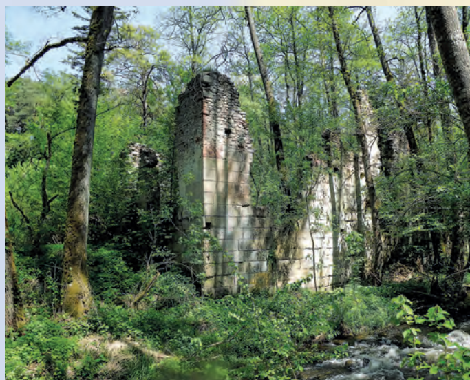
Ruiny papierni w Hamerni w Rezerwacie Czartowe Pole.

Na terenie Parku znajduje się 5 pomników przyrody ożywionej – są to pojedyncze drzewa i grupy drzew, oraz 2 pomniki przyrody nieożywionej: źródłisko rzeki Jeleń i wodospad na Jeleniu.