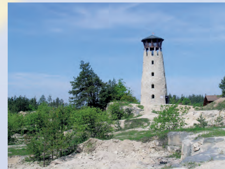
Wieża widokowa w Józefowie.

Szata roślinna Puszczy Solskiej jest urozmaicona i niezwykle interesująca. Z ciekawszych roślin objętych ochroną należy wymienić: czosnek niedźwiedzi, zachyłkę Roberta, pięć gatunków widłaków, goryczkę wąskolistną, trzy gatunki rosiczek, bagno zwyczajne, kosaćca syberyjskiego, lilię złotogłów, kilka gatunków storczyków, turzycę strunową i bagienną, grązela żółtego i turówkę wonną.