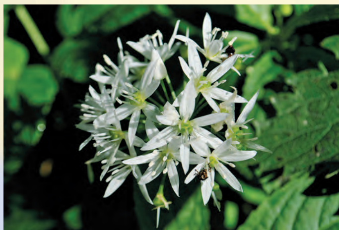
Czosnek niedźwiedzi Allium ursinum L.