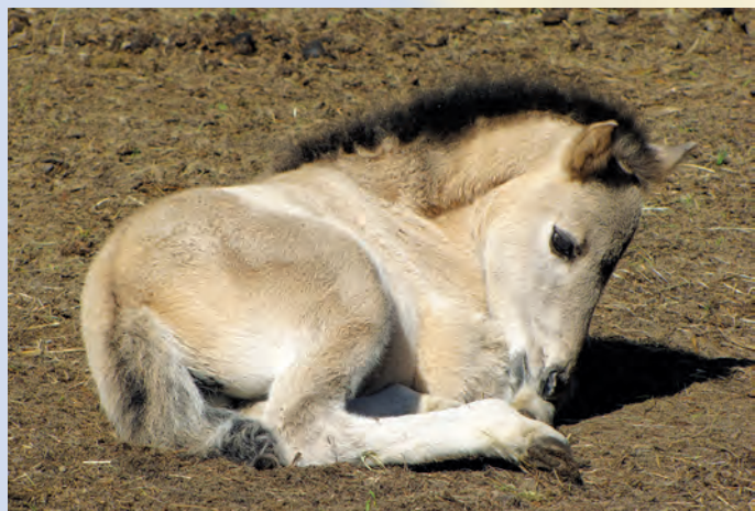
Konik biłgorajski.

W pobliżu jednej z puszczańskich wsi Szklarnia utworzono ostoję konika biłgorajskiego. Koniki, będące potomkami tarpanów, wzorem swoich przodków przez cały rok przebywają na odkrytym terenie, a dokarmiane są wyłącznie w okresie zimowym. Ich łagodny temperament, niewielki wzrost oraz przyjazny stosunek do ludzi sprawia, że można je wykorzystać w ramach hipoterapii.