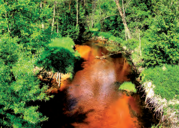
Rzeka Bukowa.