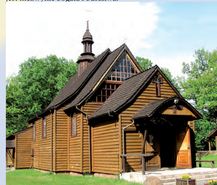
Kościół pw. Św. Wojciecha w Momotach Górnych.