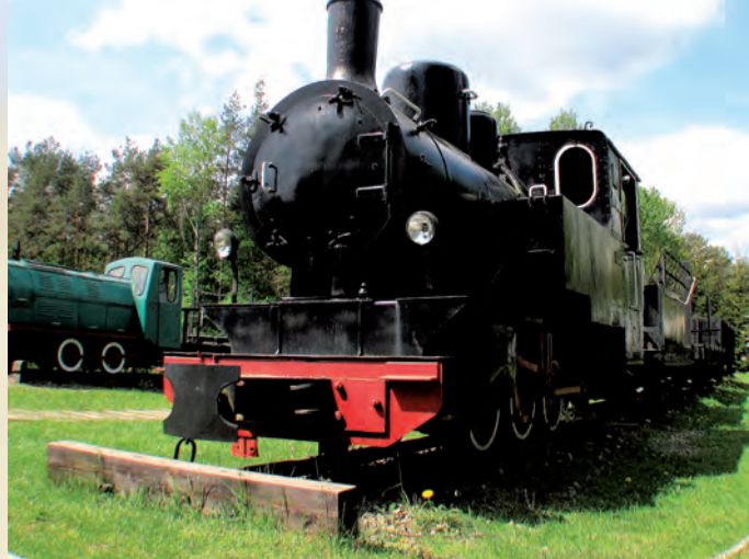
Ekspozycja taboru kolejki leśnej.