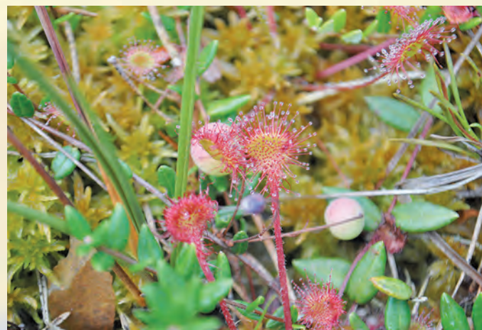
Rosiczka okrągłolistna Drosera rotundifolia L.