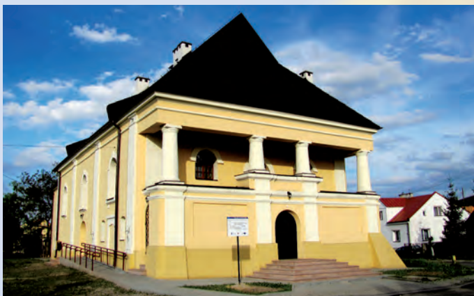
Synagoga w Modliborzycach.

Piękny krajobraz i walory przyrodnicze Lasów Janowskich czynią ten teren niezwykle atrakcyjnym dla tury-