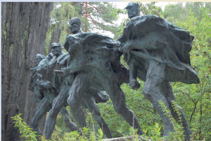
Pomnik na Porytowym Wzgórzu poświęcony partyzantom walczącym z okupantem niemieckim.