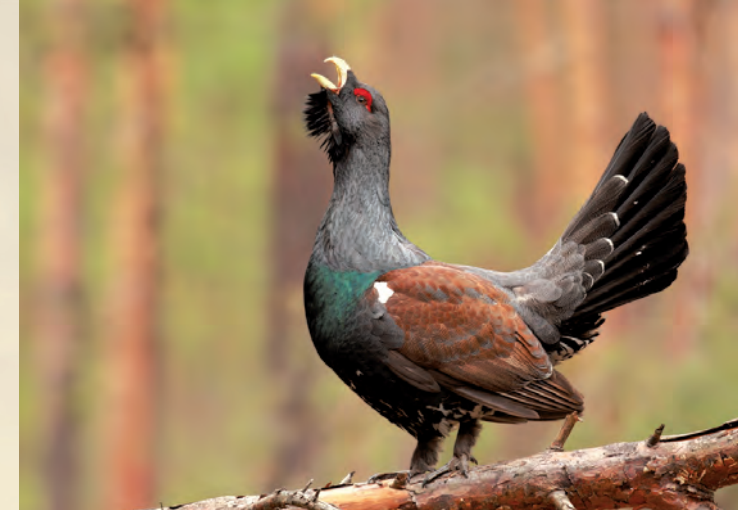
Tokujący głuszec Tetrao urogallus .

Lasy Janowskie obfitują w naturalne, mało przekształcone siedliska, co sprawia, że fauna tych lasów jest niezwykle bogata. Wśród 130 gatunków ptaków licznie reprezentowane są gatunki rzadkie m.in. rybołów, orlik krzykliwy, bielik, bocian czarny, żuraw. Na uwagę zasługuje występowanie w Lasach Janowskich głuszca – gatunku skrajnie zagrożonego wyginięciem, objętego ochroną strefową. Znakomite warunki znajdują w leśnych ostojach wilki, łosie, jelenie, dziki i wiele innych.