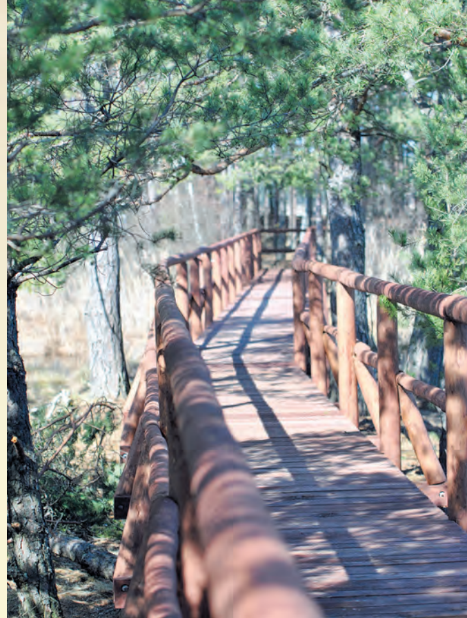
Ścieżka dydaktyczna po rezerwacie wodno-torfowiskowym Imielty Ług.