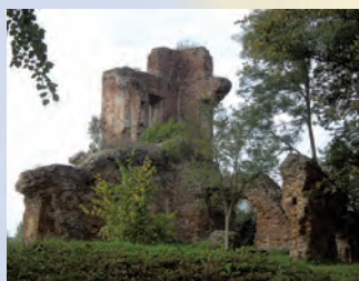
Ruiny zamku z XVII w. w Zawieprzycach.