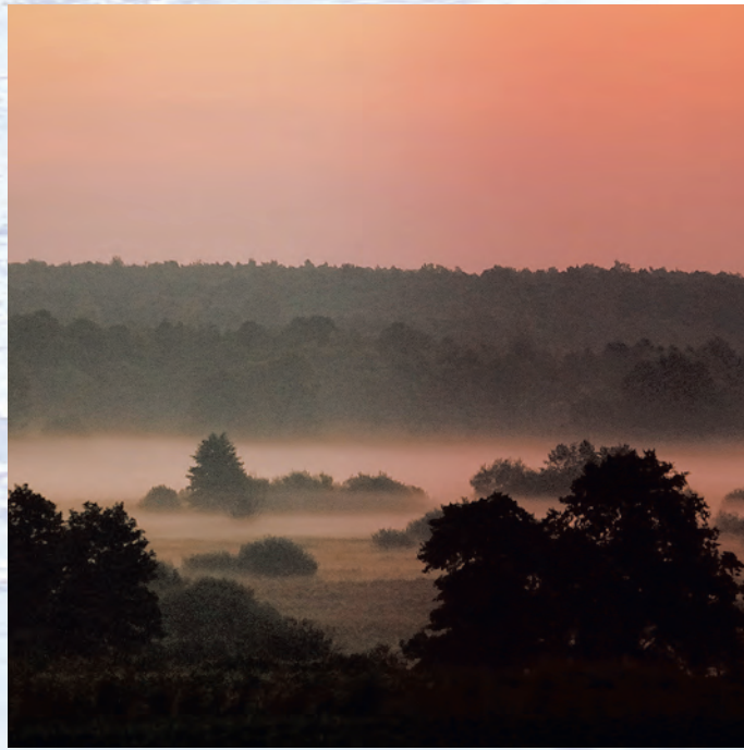
Świt nad Wieprzem.