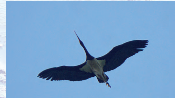
Bocian czarny Ciconia nigra .

łąki. Wśród roślin torfowiskowych osobiwością jest, rosnąca w otulinie Parku, brzoza niska, rosiczka okrągłolistna oraz rośliny wilgotnych łąk: kosaciec syberyjski i storczyk szerokolistny. Z roślin kserotermicznych wystę-