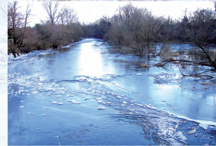
Wieprz zimą.