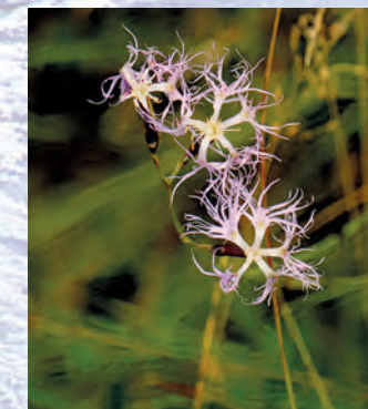
Goździk pyszny Dianthus superbus .

Na terenie Parku znajduje się ponad 20 pomników przyrody. Są to głównie sędziwe drzewa w parkach podworskich. Na szczególną uwagę zasługują pozostałości potężnej Lipy Sobieskiego w parku zamkowym w Zawieprzycach, uznane za pomnik przyrody w 1956 roku. Lipa miała w tym czasie ponad 700 cm obwodu.