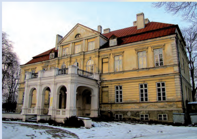
Pałac w Kijanach.

Park wraz z otuliną odznacza się wyraźnym zróżnicowaniem typów krajobrazu. W południowej części dolina Wieprza jest szeroka i silnie zabagniona. W części północnej na odcinku pomiędzy Ciechankami Krzesimowskimi, a Kijanami jest ona wąska, kręta i ma charakter przełomu przez wzniesienia Wyżyny Lubelskiej, a jej krawędzie wznoszą się miejscami do ponad 20 metrów i są porozi-nane jarami i wąwozami.