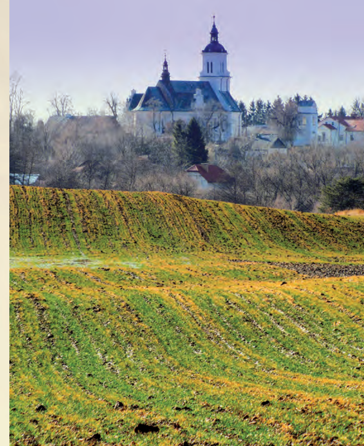
Kościół w Kijanach.

Nadwieprzański Park Krajobrazowy utworzony został w 1990 roku. Położony jest w centralnej części województwa lubelskiego nad środkowym odcinkiem Wieprza, na styku dwóch wielkich jednostek fizjograficznych: Wyżyny Małopolskiej i Nizy Zachodniorosyjskiej. Jest to jednocześnie umowna fizyczno-geograficzna granica pomiędzy Europą Wschodnią i Zachodnią.