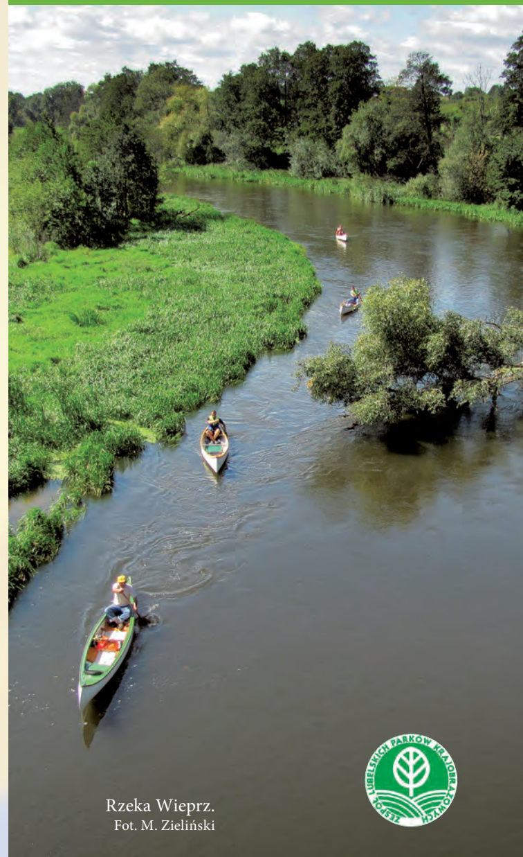
Rzeka Wieprz.