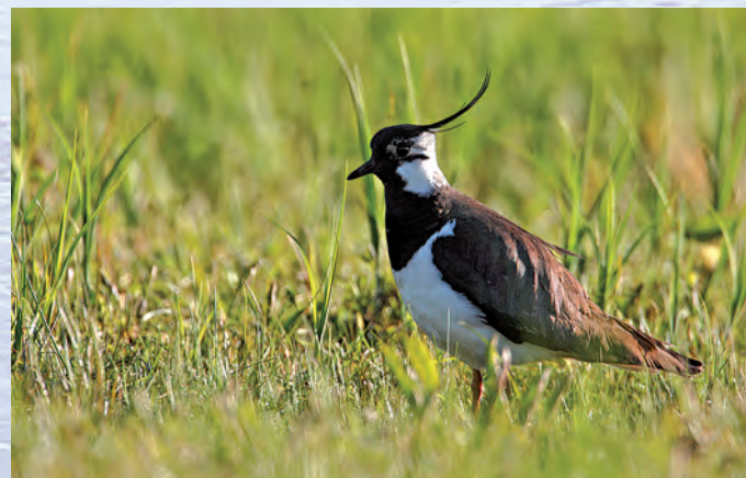
Czajka Vanellus vanellus .

łąki. Wśród roślin torfowiskowych osobiwością jest, rosnąca w otulinie Parku, brzoza niska, rosiczka okrągłolistna oraz rośliny wilgotnych łąk: kosaciec syberyjski i storczyk szerokolistny. Z roślin kserotermicznych wystę-