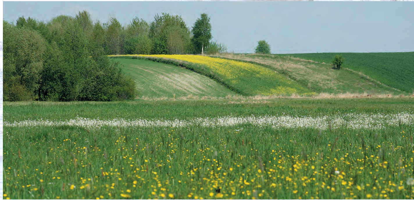
Dolina Wieprza.