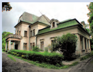
Pałac w Łysołajach.