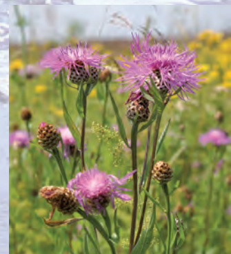
Chaber łąkowy Centaurea jacea .

W obrębie Parku do Wieprza uchodzą jego dopływy lewobrzeżne: Gielczew i Stoki oraz prawobrzeżne: Białka, Mogielnica i Świnka.