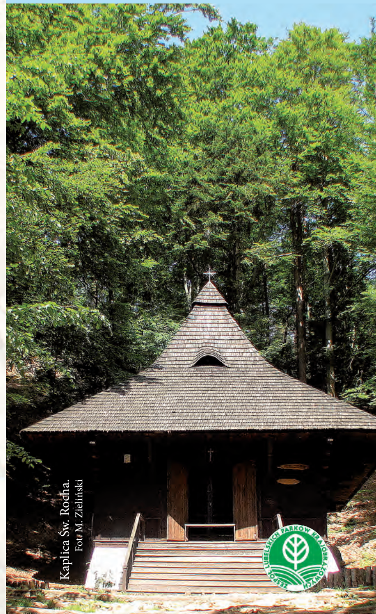
Kaplica św. Rocha.