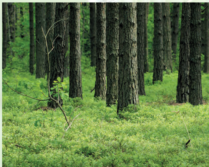
Las sosnowy w Krasnobrodzkim Parku Krajobrazowym.

kultem cudownym źródłem. Niezwykle interesująca jest też zbudowana w stylu zakopiańskim Kaplica Św. Rocha, malowniczo wkomponowana w Dolinę Św. Rocha.