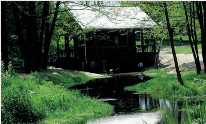
Kaplica na Wodzie z cudownym źródłem w Krasnobrodzie.