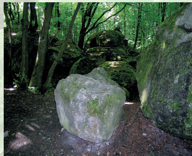
Skalki ostańcowe na Wzgórzu Kamień.