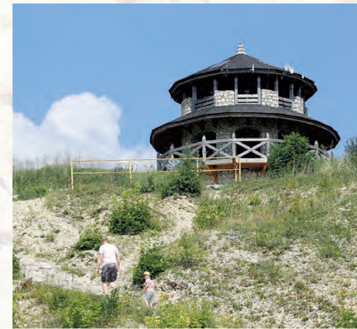
Wieża widokowa w kamieniołomie w Krasnobrodzie.

O dawnej aktywności geologicznej na terenie Krasnobrodzkiego Parku Krajobrazowego świadczy wyjątkowo malowniczy i urozmaicony krajobraz. Charakterystyczne są wychodnie skalne w formie ostańców na szczytach roztoczańskich wzniesień. Największe skupiska skałek znajdują się na wzgórzu Wapielnia (387 m n.p.m.) – najwyższym wzniesieniu Roztocza Środkowego – oraz na wzgórzu Kamień (348 m n.p.m.).