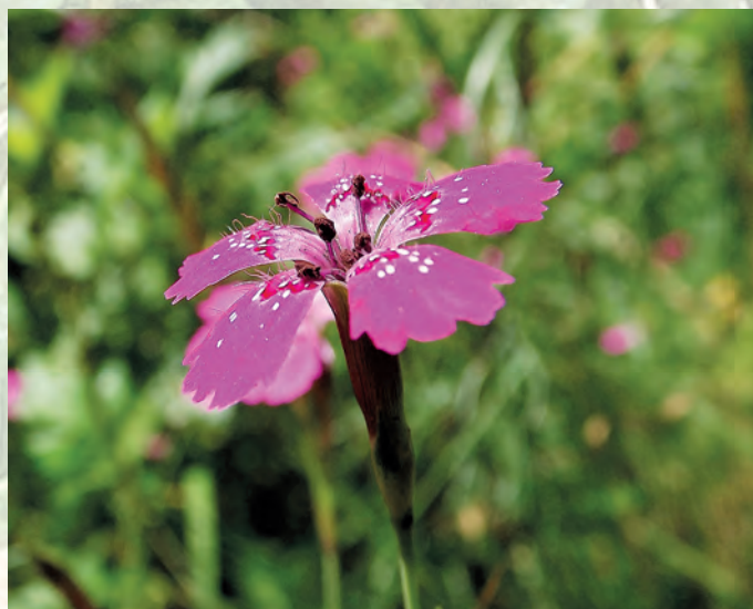
Goździk kropkowany Dianthus deltooides .