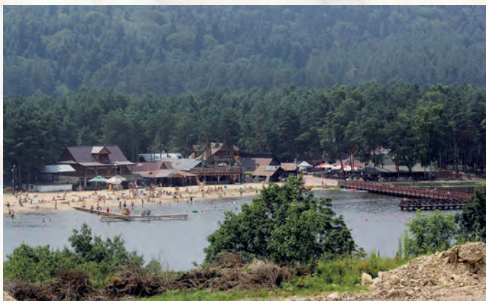
Zalew w Krasnobrodzie.

Ruch turystyczny na terenie Parku koncentruje się głównie wokół Krasnobrodu, miejscowości wczasowej i uzdrowskiej. Znajduje się tu sanatorium, kilkanaście ośrodków wypoczynkowych, szereg pensjonatów i kwatery prywatnych, kempingi, schroniska młodzieżowe oraz ośrodek turystyki konnej. W lecie popularnym miejscem uprawiania sportów wodnych jest zalew w Krasnobrodzie. Przez Park przebiegają znakowane piesze szlaki turystyczne, rowerowe oraz ścieżki spacerowe.