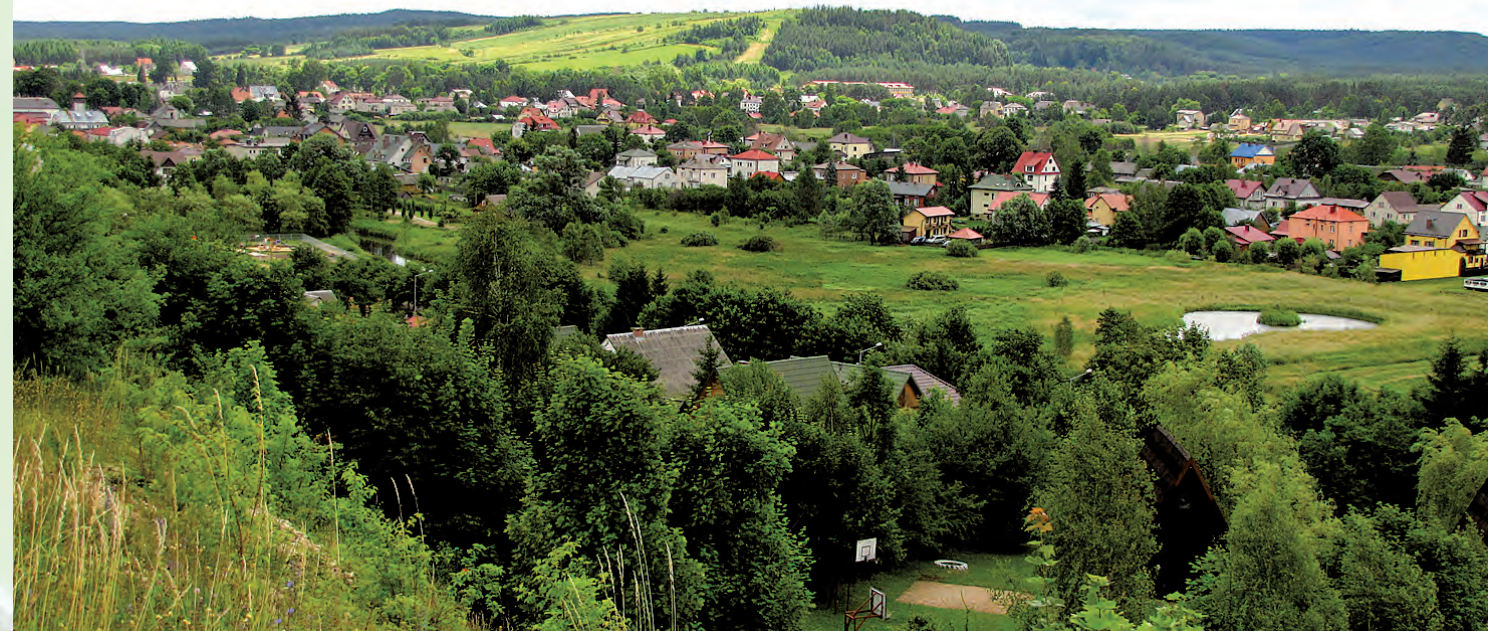
Widok na Chełmową Górę.

Z kolei w Podklasztorze znajduje się barokowy kościół (XVI wiek) z cudownym obrazem Matki Boskiej i Kalwa-