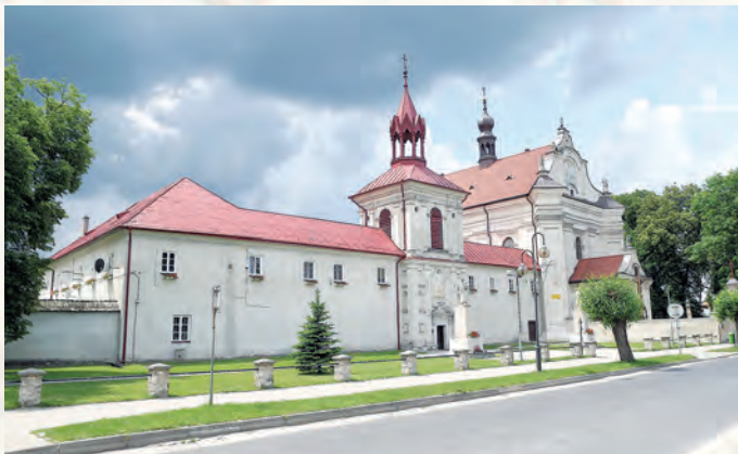
Sanktuarium Maryjne w Krasnobrodzie.