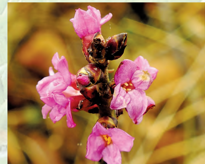
Wawrzynek wilczełyko Daphne mezereum .