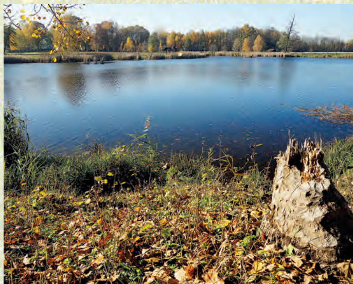
Staw w Dąbrówce.