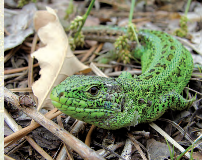
Jaszczurka zwinka.

W dolinie Mininy stwierdzono występowanie bardzo nielicznego żółwia błotnego – jedyne żółwia żyjącego naturalnie w naszym kraju. W Polsce występują tylko cztery obszary, na których odnotowano większą ilość tego gada.