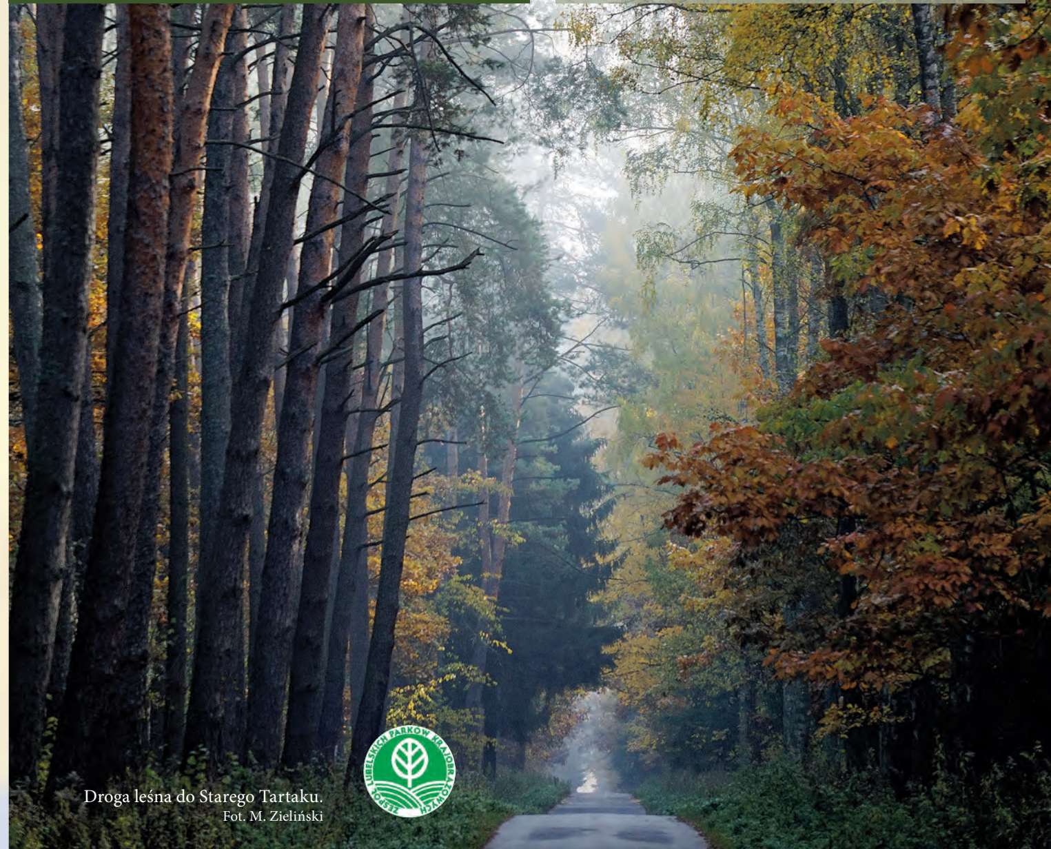
Droga leśna do Starego Tartaku.

Kozłowiecki Park Krajobrazowy utworzony został w 1990 roku w celu ochrony największego kompleksu leśnego w okolicach Lublina. Jest to Park o typowo leśnym charakterze. Swoim zasięgiem obejmuje zwarty kompleks Lasów Kozłowieckich, bardzo cenny ze względu na duże zróżnicowanie drzewostanu i fragmenty o składzie zbliżonym do naturalnego.