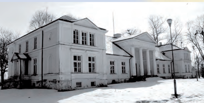
Pałac w Samokłeskach.