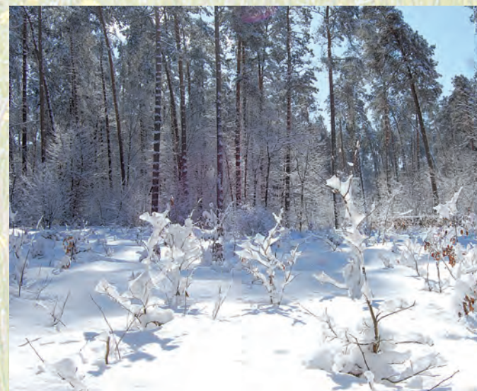
Lasy Kozłowieckie w zimowej szacie.