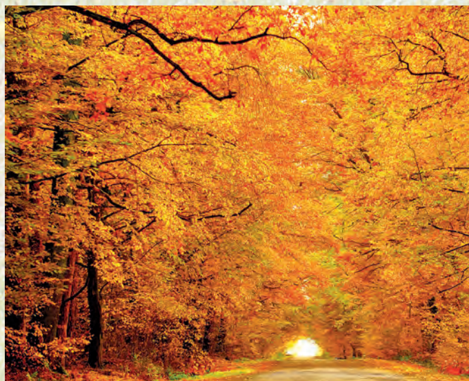
Jesień w Kozłowieckim Parku Krajobrazowym.