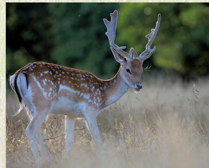
Daniel Dama dama .