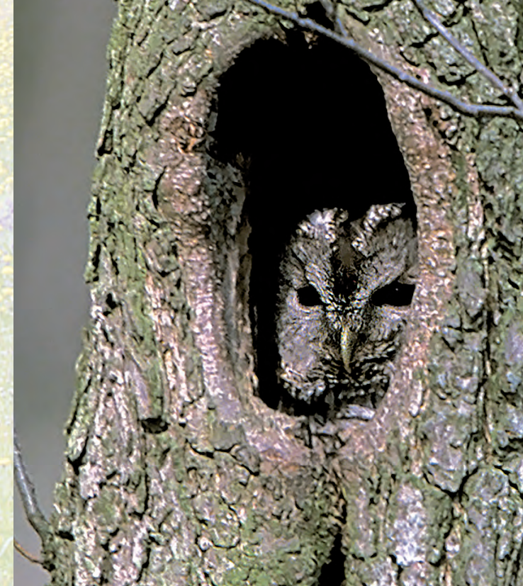
Puszczyk Strix aluco .

W otulinie Parku leży jeden z najcenniejszych zabytków kultury – późnobarokowy zespół pałacowo-parkowy w Kozłowie ze wspaniałym pałacem, kordegardą, teatralnią, wozownią i stajniami.