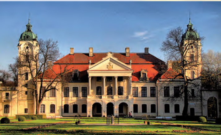
Pałac Zamoyskich w Kozłowie.

Pałac w Kozłowie został wzniesiony w I połowie XVIII wieku przez Jakuba Fontanę. Zespół pałacowy otacza piękny park z wieloma okazami starodrzewia, z których kilka uznano za pomniki przyrody. Jako wyjątkowo cenny zabytek o szczególnej wartości historycznej, naukowej i artystycznej, mający duże znaczenie dla historii Polski został uznany rozporządzeniem Prezydenta RP Pomnikiem Historii. Kolejne interesujące zespoły dworsko-parkowe pochodzące z I połowy XIX wieku znajdują się w Krasienińcu, Nasutowie i Samokłeskach. Na uwagę zasługuje stara drewniana zabudowa we wsiach: Dąbrówka, Kamionka, Nowy Staw i Nowodwór. Wart obejrzenia jest domek myśliwski położony w Starym Tartaku, a także pobliski pomnikowy dąb szypułkowy i pomnik poświęcony powstańcom styczniowym postawiony w miejscu potyczki.