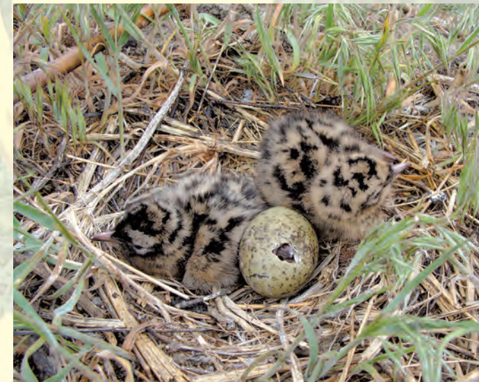
Młode mewy śmieszki Larus ridibundus .