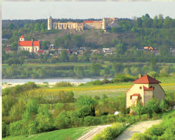
Widok na zamek w Janowcu.

Na obszarze Płaskowyżu Nałęczowskiego, czyli w lessowej i pozbawionej większych kompleksów leśnych części Parku, proces przemiany krajobrazu trwa nadal i stanowi jedną z jego najbardziej charakterystycznych cech. Sieć wąwozów osiągnęła w zachodniej części płaskowyżu rekordową gęstość 11 km/km 2 . Najbardziej atrakcyjnymi formami erozji są głębokie, stromościenne jary oraz formy antropogeniczne – głęboznice, które powstały poprzez stopniowe pogłębianie się dróg gruntowych. Rzeźba Równiny Bełżyckiej jest znacznie bardziej monotonna, a krajobraz ożywiają jedynie wydmy piaszczyste, często porośnięte drzewostanami sosnowymi. Najbardziej wyróżniającym się elementem krajobrazu jest stroma krawędź o tektonicznym pochodzeniu o wysokości ponad 90 m. Rozciągają się z niej rozległe widoki na zupełnie płaską Kotlinę Chodelską. Szczególne walory krajobrazowe posiada Małopolski Przełom Wisły. Na linii Podgórz – Janowiec dolina Wisły zwęża się do stromościennego „kanionu” o szerokości niewiele ponad 1 km. Prawe lessowe zbocze doliny wznosi się do 90 metrów nad poziom rzeki, lewe pozbawione lessu jest niższe, ale równie strome. Wisła na tym odcinku zachowała cechy dużej, dzikiej rzeki.