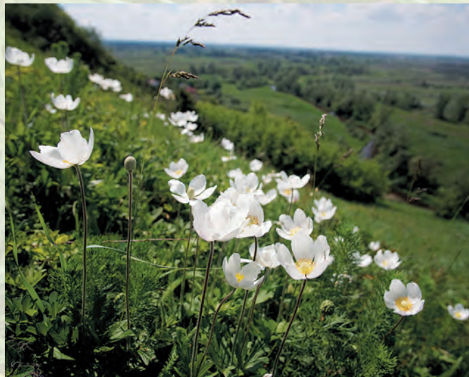
Łany zawilców wielkokwiatowych w Rezerwacie Skarpa Dobrska.

Szczególnie atrakcyjnym miejscem do obserwacji ptaków jest dolina Wisły. Można zaobserwować tutaj m.in.: rybitwę rzeczną i białoczelną, siewczkę rzeczną i obrożną, mewę siwą, śmieszkę, mewę czarnogłową i mewę białogłową.