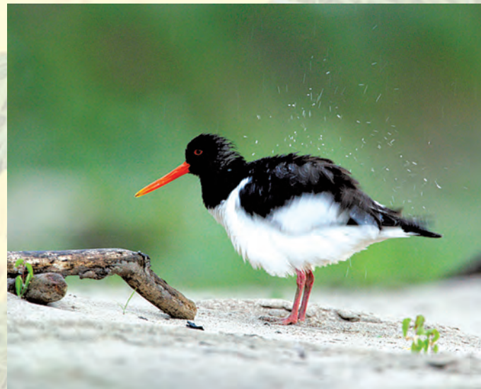
Ostrygojad Haematopus ostralegus .

W celu ochrony szczególnych walorów faunistycznych, krajobrazowych, geologicznych i florystycznych w Parku zostały utworzone 3 rezerваты: „Krowia Wyspa”, „Skarpa Dobrska”, „Łęg na Kępie”.