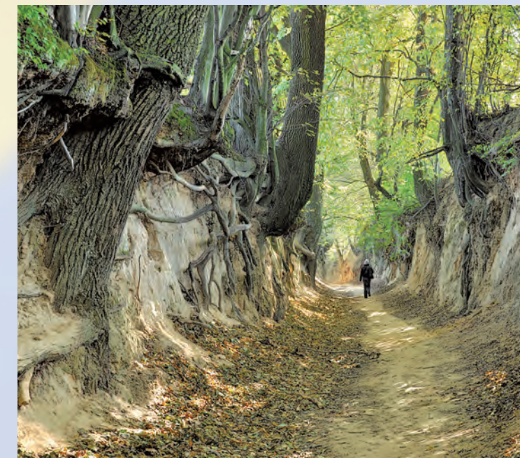
Korzeniowy Dół to jedna ze ścieżek dydaktycznych Kazimierskiego Parku Krajobrazowego.

Niezwykle interesująca jest budowa geologiczna Parku. Jego podłoże tworzą skały wapienne powstałe w ciepłym, płytkim morzu, w okresie kredy. Obumarłe zwierzęta morskie, opadające na dno, ulegały przeobrażeniom. Ślady życia z tego okresu znajdujemy do dziś w kamieniołomach na terenie Parku, w postaci zachowanych fragmentów organizmów lub ich odcinków. Na krajobraz Parku miały również wpływ zlodowacenia, a przede wszystkim przyniesione przez wiatr wielkie ilości pyłu lessowego, który miejscami tworzy ponad 30-metrowej grubości pokrywę. Wyjątkowo podatne na rozmywanie wyniosłości lessowe rozcięte zostały przez niezliczoną ilość wąwozów.