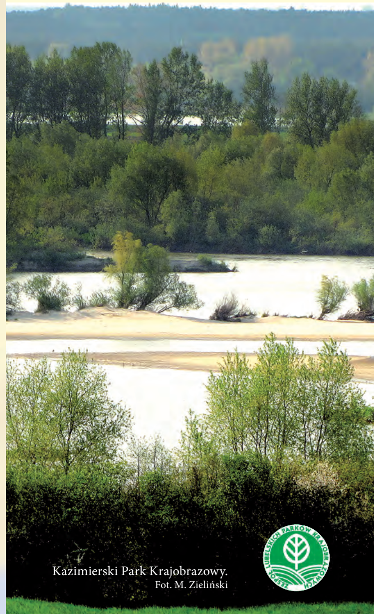
Kazimierski Park Krajobrazowy.