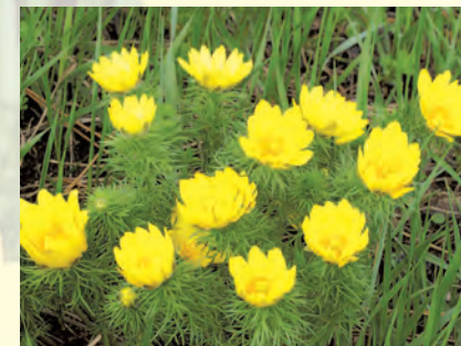
Miłek wiosenny Adonis vernalis .