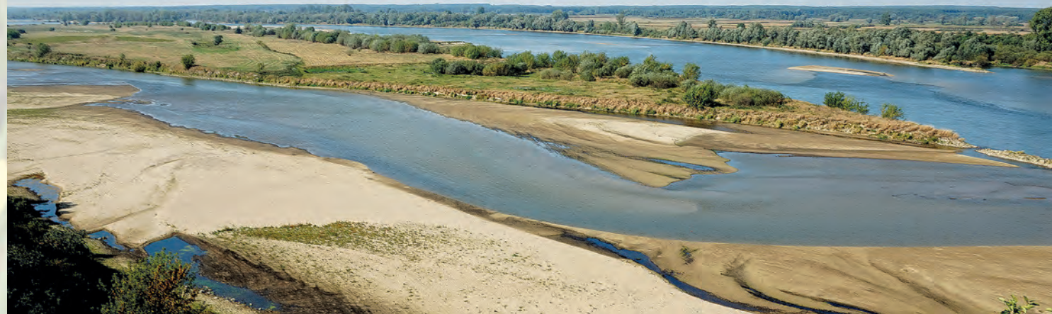
Rezerwat Krowia Wyspa.

głową. Ciekawostką jest, że w rezerwacie „Krowia Wyspa” koło Miećmierza, stwierdzono gniazdowanie ostrygojada. Jest to rzadko spotykany ptak lęgowy, występujący głównie na wybrzeżu.