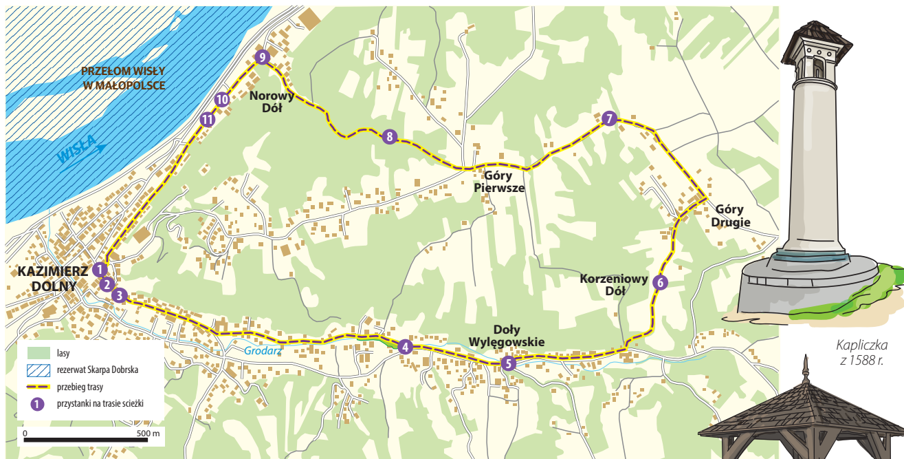
Kapliczka z 1588 r.

przemysłanych inwestycji drogowych i procesów erozji. Zobaczymy miejsce, gdzie przed wiekami znajdował się port rzeczny oraz stare spichlerze zbożowe. Na trasie znajduje się Muzeum Przyrodnicze, które koniecznie należy zwiedzić. Przejście samej trasy zajmie nam około 2-2,5 godzin.