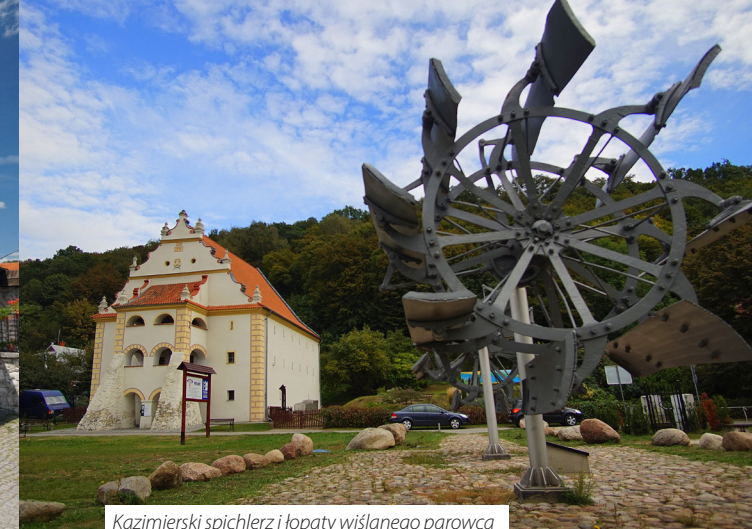
Kazimierski spichlerz i topaty wiślanego parowca