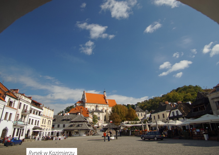
Rynek w Kazimierzu