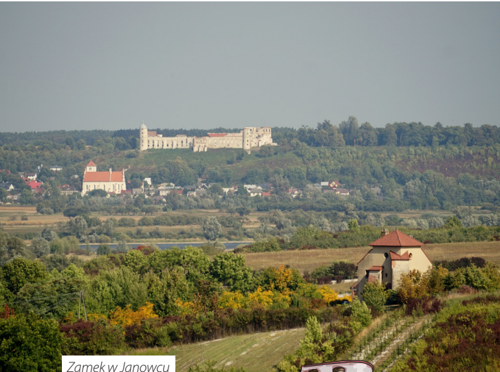
Zamek w Janowcu