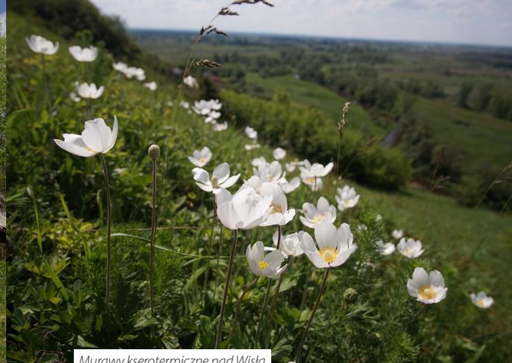
Murawy kserotermiczne nad Wisłą