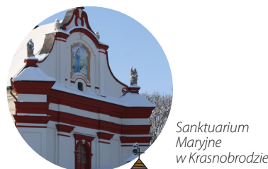
Sanktuarium Maryjne w Krasnobrodzie