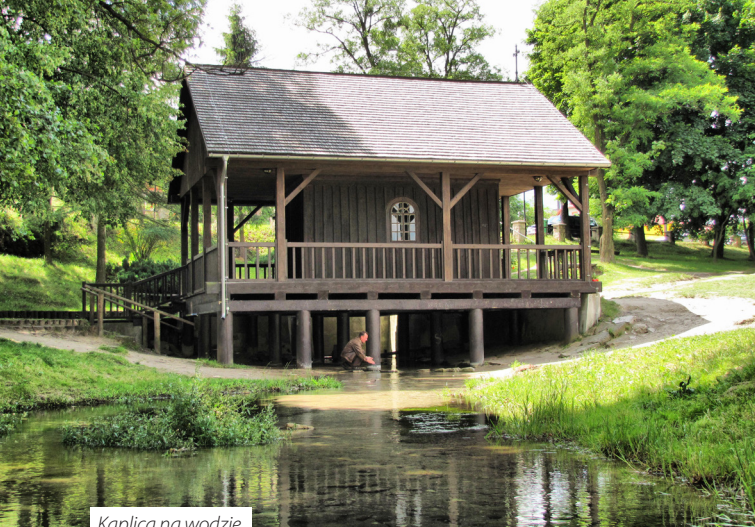
Kaplica na wodzie