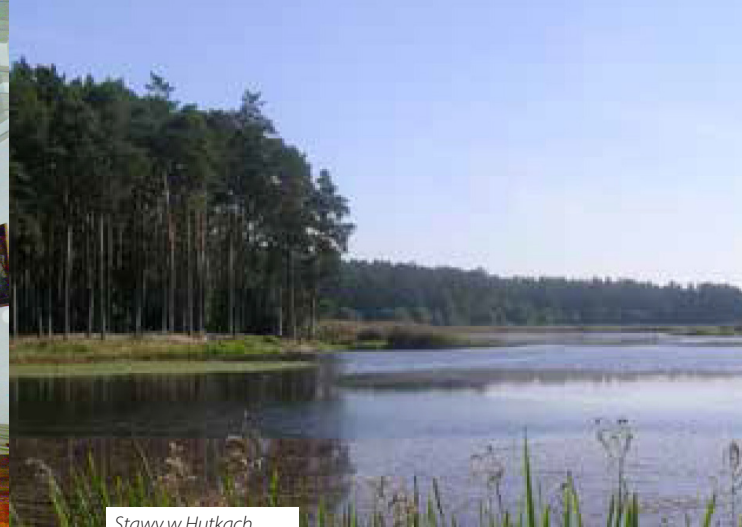
Stawy w Hutkach