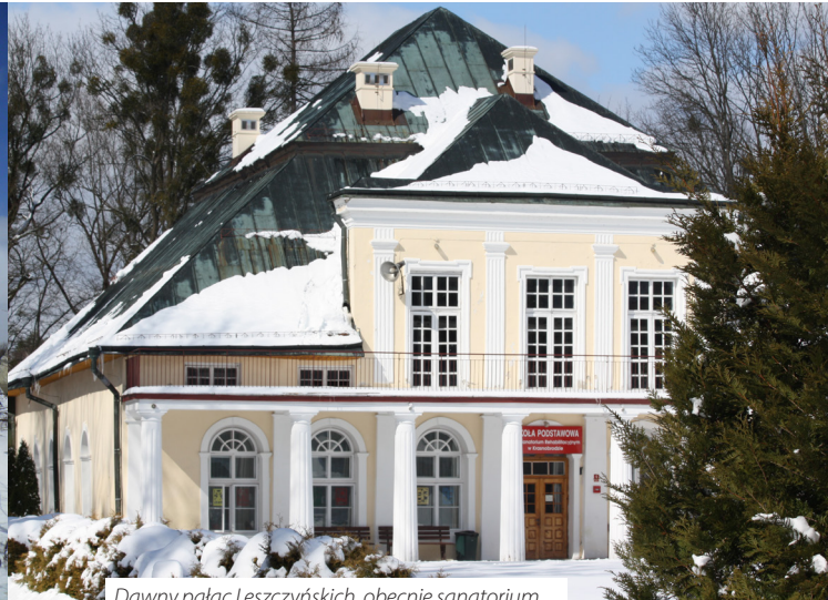
Dawny pałac Leszczyńskich, obecnie sanatorium