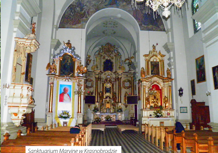
Sanktuarium Maryjne w Krasnobrodzie