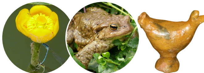
Grażel żółty i Łątką dziewczeczka

z tego wzniesienia to o wysokości 336 m n.p.m. podziwiamy piękne kompleksy leśne i wzgórza położone w północno-zachodniej części Krasnobrodzkiego Parku Krajobrazowego.