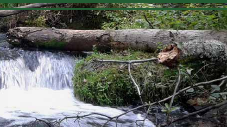
Zalew w Józefowie

ZESPÓŁ LUBELSKICH PARKÓW KRAJOBRAZOWYCH ul. Mieczysława Karłowicza 4 20-027 Lublin www.parki.lubelskie.pl Opracowanie: Zespół Lubelskich Parków Krajobrazowych Ośrodek Zamiejscowy w Zamościu © Zespół Lubelskich Parków Krajobrazowych © Euro Pilot Sp. z o.o. Druk, skład, opracowanie kartograficzne Euro Pilot Sp. z o.o. ul. Konarskiego 3, 01-252 Warszawa tel. 22 664 37 20 www.europilot.com.pl biuro@europilot.com.pl ISBN 978-83-8218-009-1