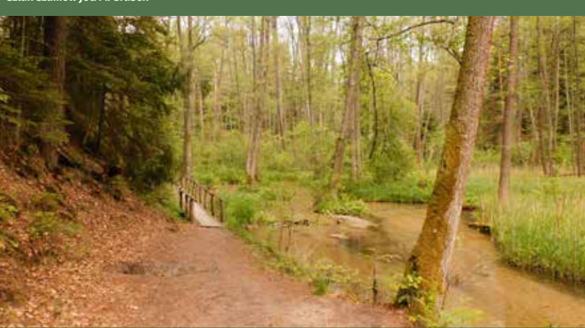
Szlak Szumów

Baza turystyczna na terenie Parku jest dość dobrze rozwinięta. Główne ośrodki turystyczne stanowią takie miejscowości jak: Susiec, Józefów, Narol czy Huta Różaniecka. Przez bory Parku przebiega wiele ścieżek i szlaków turystycznych: zielony „Szlak Ziemi Józefowskiej”, czerwony „Szlak Krawędziowy”, niebieski „Szlak Szumów”, czarny „Szlak Walk Partyzanckich”, żółty „Szlak Potudniowy”, zielony „Szlak Władysławy Podobińskiej”. Poza tym przebiega tędy centralny szlak rowerowy Roztocza (Kraśnik – Lwów) i trasa rowerowa Ziemi Józefowskiej. Droga od Józefowa do Suśca wiezie szlak rowerowy GreenVelo. Do miejsc atrakcyjnych turystycznie należą kamieniołomy: w Nowinach, w Hucie Różanieckiej oraz „Babia Dolina” w Józefowie.