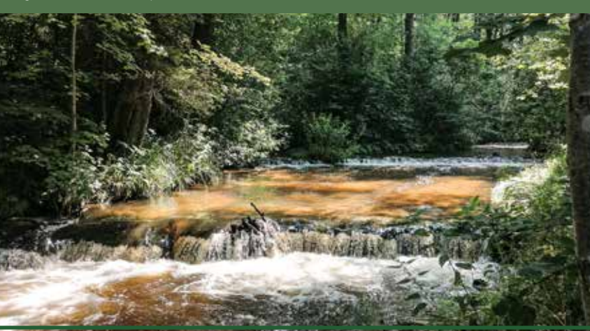
Progi skalne na rzece Tanew

„Czartowe Pole” (63,71 ha) – rezerwat krajobrazowo-leśny stworzony w celu ochrony doliny rzeki Sopot z serią wodospadów. „Nad Tanwią” (41,33 ha) – rezerwat ścisły, utworzony w celu ochrony przetomowego odcinka Tanwi i ujściowego odcinka rzeki Jeleń. To tutaj znajdują się malownicze progi skalne zwane szumami. „Bukowy Las” (86,29 ha) – rezerwat leśny, utworzony w celu zachowania zespołów buczyny karpackiej w formie podgórskiej. Pomniki przyrody ożywionej: są to głównie grupy drzew znajdujące się na terenie parku podworskiego w Majdanie Nepsykim (lipy drobnolistne, klony pospolite, świerki pospolite, robinie akacjowe). Pomniki przyrody nieożywionej: wodospad na rzece Jeleń w obrębie gminy Susiec – największy próg skalny w obrębie strefy krawędzowej Roztocza; źródłisko rzeki Jeleń zasilające zbiornik wodny zwany „Morskim Okiem”. Także źródła Niepryszki w Józefowie.