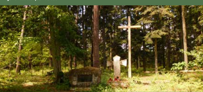
Wzgórze Kościółek

Do najważniejszych zabytków na terenie Parku należą: neobarokowy kościół z 1886 r. oraz XIX-wieczna synagoga i kirkut w Józefowie, zespół kościoła parafialnego św. Jana Nepomucena z XIX w. w Suścu, ruiny papierni Zamojskich w rezerwacie Czartowe Pole oraz drewniany młyn wodny z 1925 roku w Suścu. Do ważnych punktów na mapie Parku Krajobrazowego Puszczy Solskiej należą miejsca pamięci narodowej: partyzancki cmentarz z II wojny światowej w Osuchach, cmentarz i miejsce po obozie założonym przez NKWD w Błudku, pomniki na uroczysku Maziarze i Krzywej Górze. Wspomnieć również należy o stanowisku archeologicznym czyli „Zamczysku” inaczej nazywane „Kościółek”. Jest to wał ziemny dawnego zamczyska wybudowanego w widłach Tanwi i Jelenia. W XVII wieku wybudowano tam cerkiew zamienioną w 1748 r. na kościół. Podczas powstania styczniowego i w czasie II wojny światowej ukrywali się tu partyzanci, co upamiętniają krzyż i pomnik. W części podkarpackiej parku znajduje się Narol – miejscowość należąca niegdyś do możnego rodu Łosów. Z inicjatywy Antoniego Feliksa powstała okazała rezydencja, gdzie zgromadzono kolekcję unikalnych dzieł sztuki. Pałac został doszczętnie ograbiony w czasie II wojny światowej. Obecnie świetność przywróciła mu Fundacja Pro Academia Narolense. Warto też zobaczyć ruiny cerkwi w Hucie Różanieckiej.