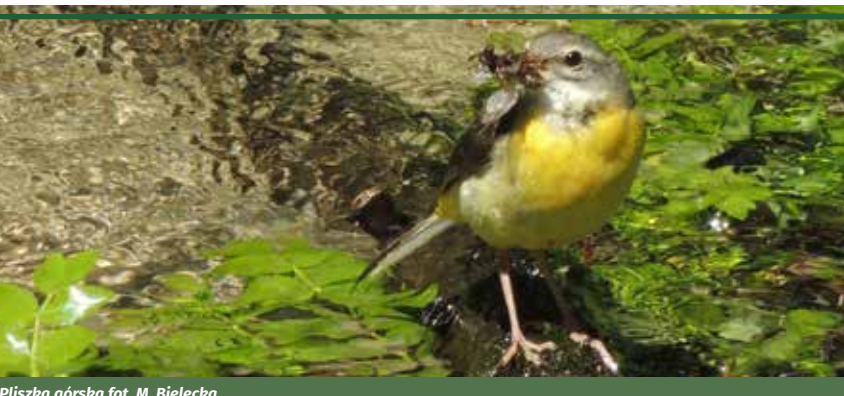
Płaska górska