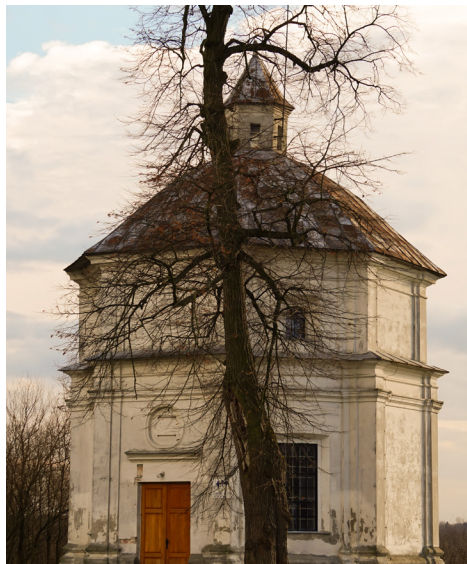
Kaplica zamkowa w Zawieprzycach

na gospodarowanie w żyznej dolinie. Obok starych grodów zaczęły powstawać osady kmiecie, które stopniowo rozrastały się do rozmiarów dzisiejszych wsi. Niemal wszystkie wsie położone na terenie Parku istniały już w XIV wieku, o czym wspomina Jan Długosz w spisie miejscowości diecezji krakowskiej. Wsie ciągnęły się wzdłuż szlaków komunikacyjnych po obydwu stronach Wieprza, i zachowały swój kształt do czasów dzisiejszych. Na przelomie XIX i XX wieku, na bazie