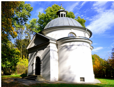
Kaplica w Łysołajach

na gospodarowanie w żyznej dolinie. Obok starych grodów zaczęły powstawać osady kmiecie, które stopniowo rozrastały się do rozmiarów dzisiejszych wsi. Niemal wszystkie wsie położone na terenie Parku istniały już w XIV wieku, o czym wspomina Jan Długosz w spisie miejscowości diecezji krakowskiej. Wsie ciągnęły się wzdłuż szlaków komunikacyjnych po obydwu stronach Wieprza, i zachowały swój kształt do czasów dzisiejszych. Na przelomie XIX i XX wieku, na bazie