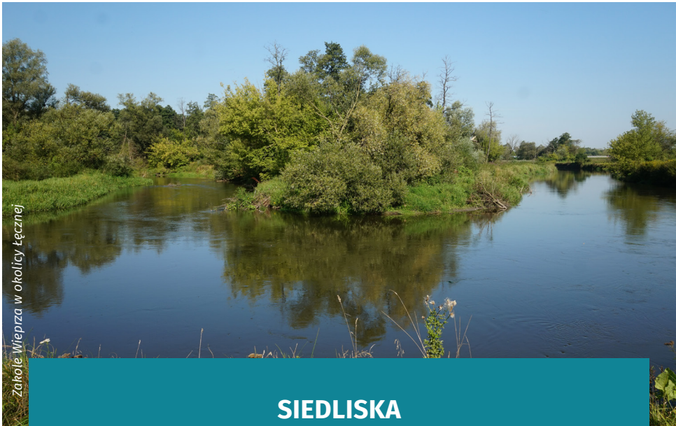
Zakole Wieprza w okolicy Łęcznej