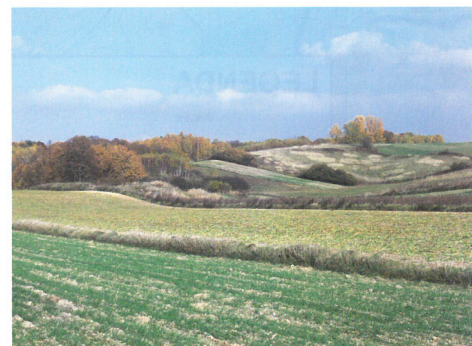
Okolice Sulmici

malowniczych rozcięć erozyjnych w postaci dolin z wąwozami oraz lasów gradowo-bukowych. Ponadto na terenie Parku znajduje się drugi rezerwat - "Broczówka", w którym ochronie podlegają murawy kserotermiczne.