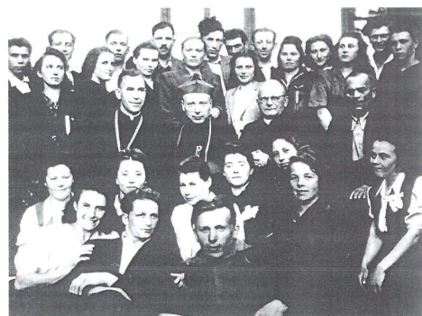
Ks. Wyszyński z członkami chóru podczas wizytacji w 1948 r.

Dnia 26 października 1956 r. Stefan kardynał Wyszyński został uwolniony. Wrócił do Warszawy wśród wielkiej radości i nadziei Kościoła w Polsce. W latach 1957–1965 prowadził Wielką Nowennę przed Jubileuszem Tysiąclecia Chrztu Polski. W 1957 r. rozpoczęło się składające się na nią nawiedzenie kopii Obrazu Matki Bożej Częstochowskiej. Na główne uroczystości milenijne zaplanowane