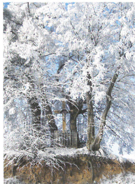
Krzyż w Podwysokim

i Nauk Społecznych uzyskał stopień doktora na podstawie pracy: "Prawa Kościoła do szkoły". Po studiach udał się w podróż naukową po krajach Europy Zachodniej. Po powrocie do ojczyzny został profesorem nauk społecznych w Wyższym Seminarium Duchownym we Włocławku, a także redaktorem miesięcznika "Ateneum Kapłańskie".