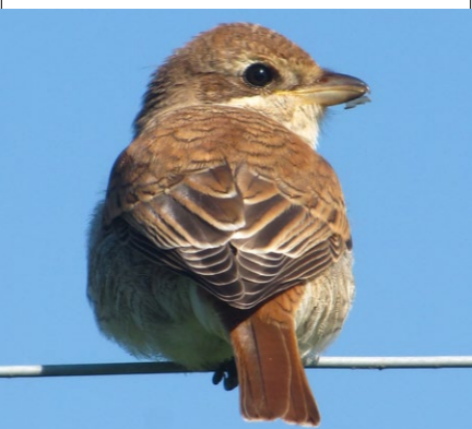
Gąsiorek (osobnik młodociany)