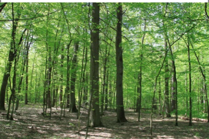
Rezerwat przyrody „Stary Las”