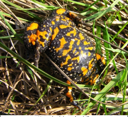
Kumak nizinny (spód)