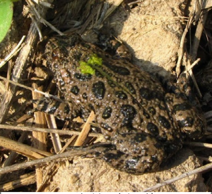
Kumak nizinny (wierzch)