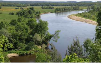
Podlaski przełom Bugu