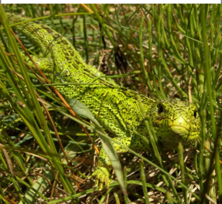
Jaszczurka zwinka (samiec)