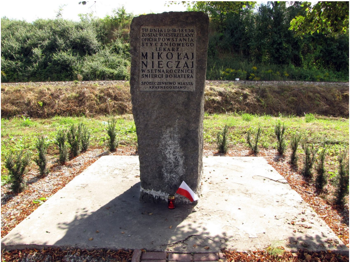
Рис. 4. Місце страти М. Нечая у Красноставі