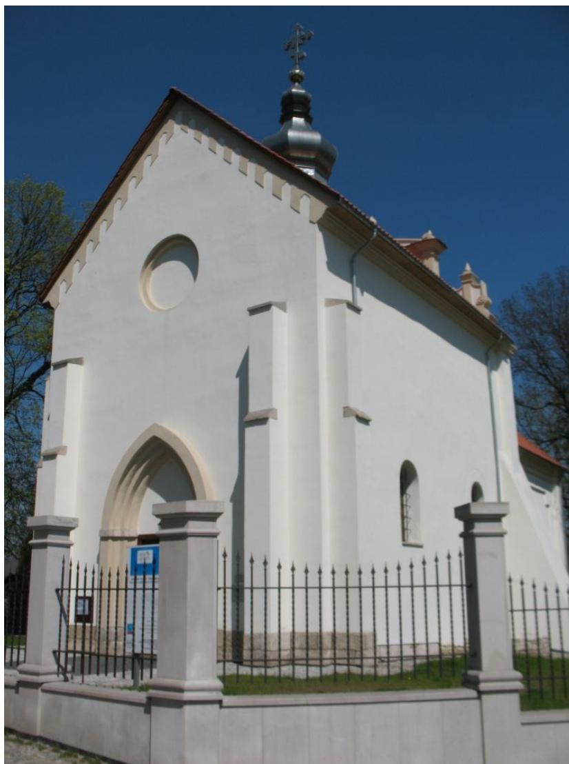
Рис. 3. Мурована церква в Щебрешині XII-XVIII ст.