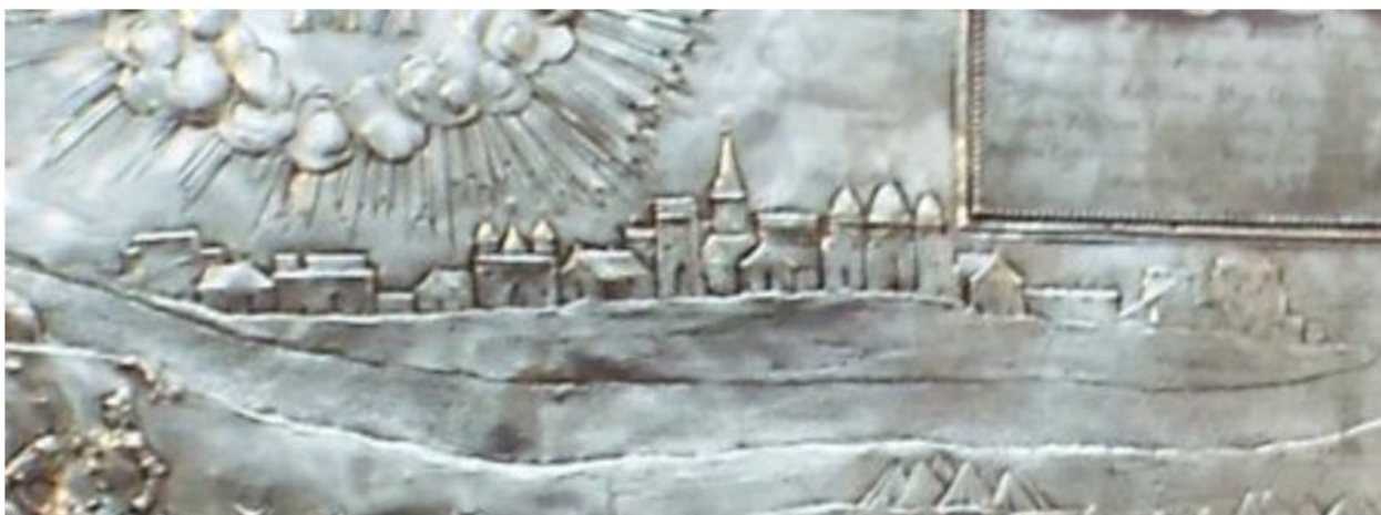
Рис. 6. Імовірне зображення Холму на срібній оздобі олтаря Холмської базилики

Przyjęcie Unii doprowadziło do rozłamu w środowisku Rusinów – na prawosławnych – na wschodzie i unitów – na zachodzie. Rozłam ten doprowadził do tego, że w czasie powstania Chmielnickiego Rusini-uniti opowiedzieli się przeciwko swoim prawosławnym rodakom ze wschodu po stronie Rzeczypospolitej. Unaocznia to srebrne antepedium z bazyliki w Chełmie, zamówione przez bazylianów w Gdańsku, z obrazem zwycięstwa Polaków pod Beresteczkiem. Nawiasem mówiąc, naukowcy zakładają, że zawiera on najstarszy wizerunek Chełma [3].