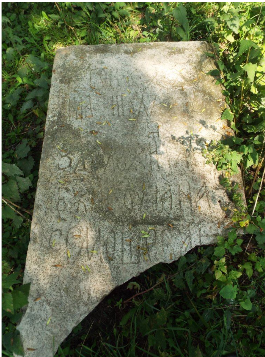
Рис. 5. Сучасний стан нагробної плити Уляни Єрмошевої 1606 р. Фото І. Парнікози, 2018 р.